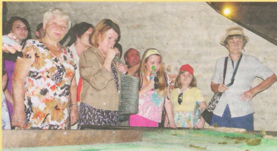
Podczas wycieczki obejrzelśmy makiety grodu Lublin

A w następną środę udamy się z wizytą do gospodarza miasta. Zwiedzimy ratusz.