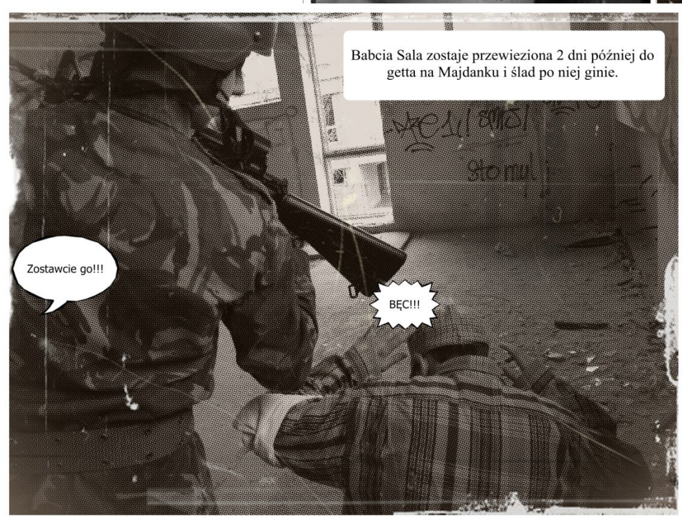
Babcia Sala zostaje przewieziona 2 dni później do getta na Majdanku i ślad po niej ginie.