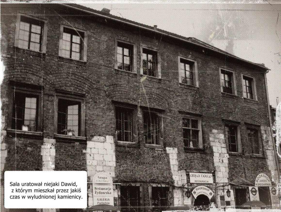
Sala uratował niejaki Dawid, z którym mieszkał przez jakiś czas w wyludnionej kamienicy.