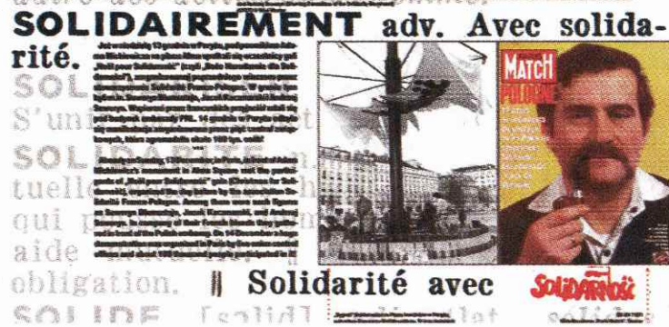
O godzinie 13.30 na placu Litewskim zostanie otwarta wystawa przygotowana przez lubelski oddział Instytutu Pamięci Narodowej pt. „Wasza Solidarność – nasza wolność” o reakcjach emigracji polskiej i świata na wprowadzenie stanu wojennego