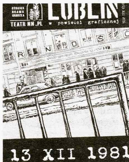
Okładka „13 XII 1981”

Tytułowa „Zuzia” to imię nadane powielaczowi używanemu do produkcji podziemnego pisma „Spotkania”. Oprócz „Spotkań...” Brama Grodzka – Teatr NN wydał też minikomiks „13 XII 1981” Pałki, opowiadający o stanie wojennym.