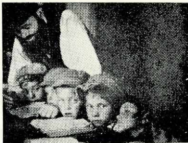
אין א לובלינער חדר

בזמן שהיה למישהו "יום זיכרון" ("יאצרייט"), עשו מנין גם בימי חול, אבל רק לתפילת ערבית. בראש השנה וביום כיפור בלבד סגרו את החנויות ולא עסקו במסחר.