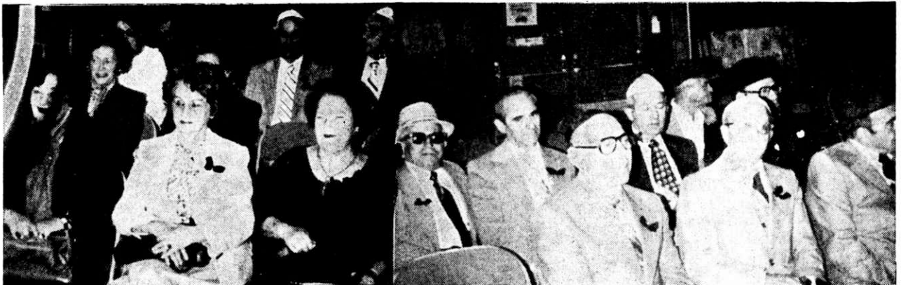
אַ טייל פון עולם אויף דער אזכרה אין לאַס-אַנזשעלעס

ס'איז געווען אַן איינדרוקספולע אונטער- נעמונג, פול מיט יראת-הכבוד פאַר אונדזערע קרושים. פּרידאָ האַכבוים / פּתח-תּקווה