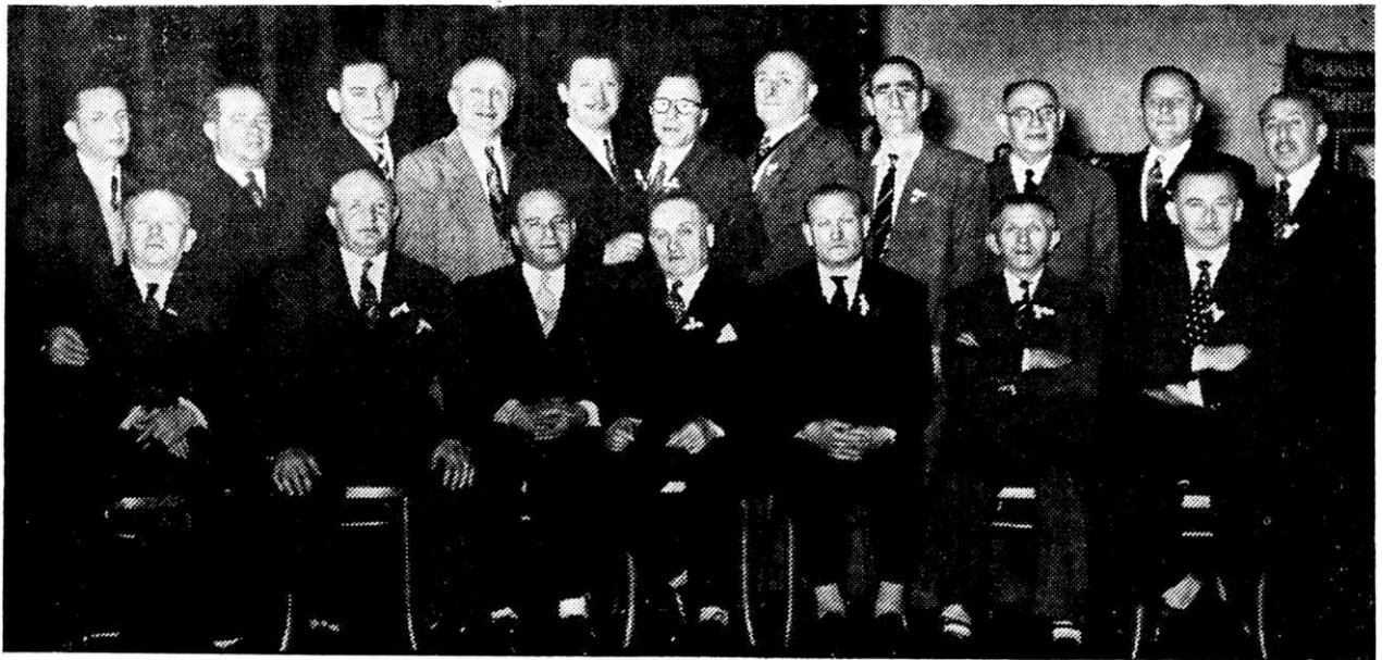
קאמיטעט-מיטגלידער און אקטיוויסטן פון דער לובלינער לאנדסמאנשאפט אין בוענאס-איירעס, אין די דרייסיקער יארן.

דער גאנצער וועלט, אינטערעסירט זיך נישט מיט די שורשים און מקורות; פון וואנען שטאמען די עלטערן, וואו זענען זיי געבוירן און דערצויגן געווארן? אבער מיר, די ווייניק פארבליבענע, ווי לאנג די כוחות וועלן טראגן, וועלן אויפ-האלטן דעם נאמען פון אונדזער עיר ואם בישראל, לובלין. מיר וועלן זיך באמיען צו העלפן, אז דער זשורנאל „קול לובלין“ זאל זיך אנטוויקלען. אייד, עסקנים, שרייבערס און טוערס זאלן זיין די הענט געבענטשט. באמיט זיך, אז דער וועלט צוזאמענפאר פון די לובלינער זאל פארקומען אלע דריי יאר, און נישט אלע פינף יאר, ווייל מיר עלטערן זיך און טארן נישט אפלייגן אויף שפעטער אזעל-כע עניינים. דאס איז מיין פערזענלעכער פארשלאג — און האלעוויי זאל ער ווערן רעאליזירט!