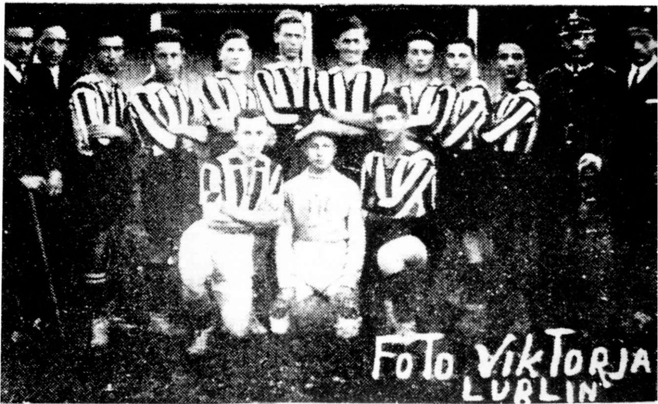
מועדן ספורט "מכבי" לפני השואה

דעם 28 סעפטעמבער, ווען דער צוג האָט זיך אין אַ נאַווענע אַפּגעשטעלט (ער פלעגט זיך אַפּשטעלן אלע וויילע) – מיר זיינען שוין געווען ניט ווייט פון לובלין, האָט דער נאַטשאַלניק געמאַלדן די פּאַסאַזשירן, אַז די באַן וועט ווייטער ניט גיין, אין לובלין זיינען די דייטשן (שפעטער האָב איך זיך דערוויסט, אַז לובלין איז שוין געווען פאַרנומען מיט 10 טעג צוריק). ער האָט פאַרגעלייגט, אַז אלע וואָס ווילן זיך אומקערן קיין ראָוונע, זאָלן בלייבן אין באַן, די איבעריקע קענען ווייטער גיין צו פּוס. אין דעם טאָג האָבן סטאַלין-רוסלאַנד און היטלער-