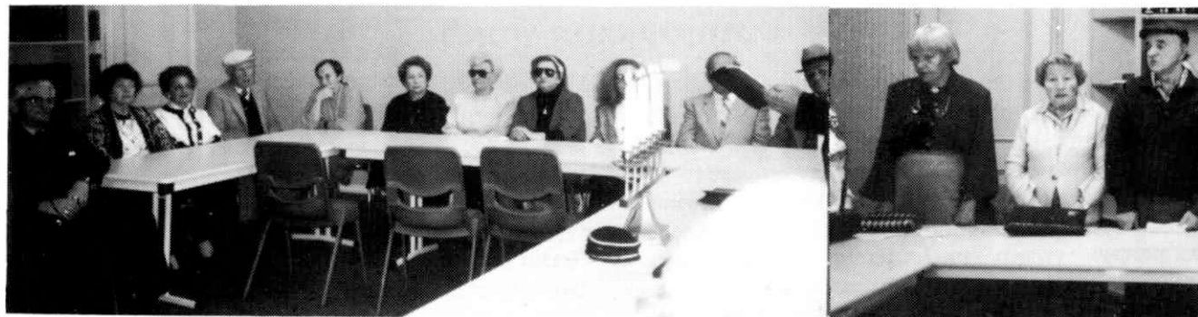
די אזכרה נאך די קדושים פון לובלין אין מעלבורן, אויסטראליע אזכרה לקדושי לובלין במלבורן, אוסטרליה