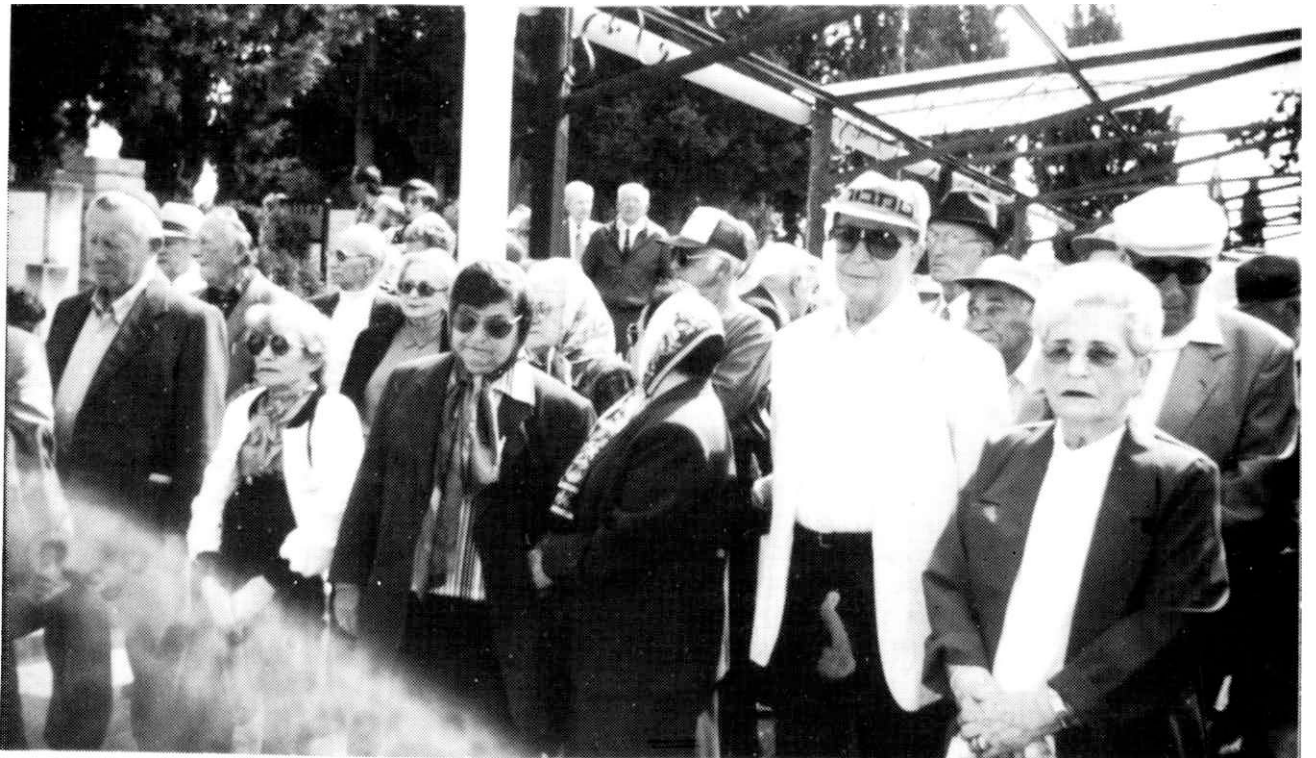
די אזכרה אין נחלת יצחק, ביי דער מצבה לזכר די קדושים פון לובלין און מייידאנעק אזכרה בנחלת יצחק, ליד המצבה לזכר קדושי לובלין ומייידאנעק