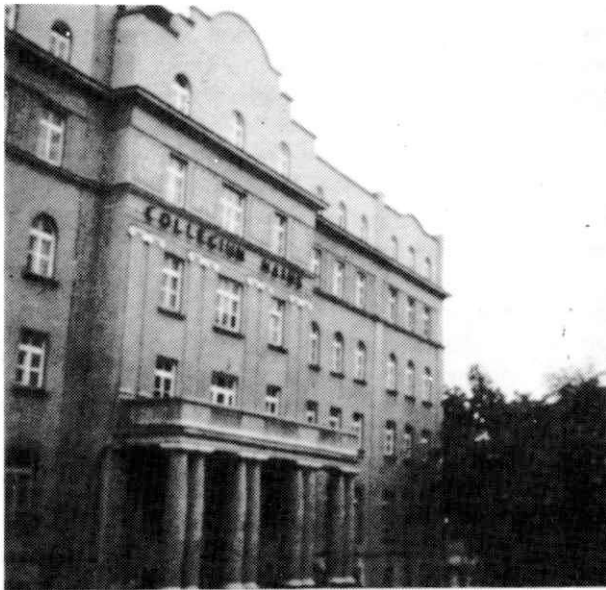
די ישיבת חכמי לובלין. היינט - א מעדיציניע שול