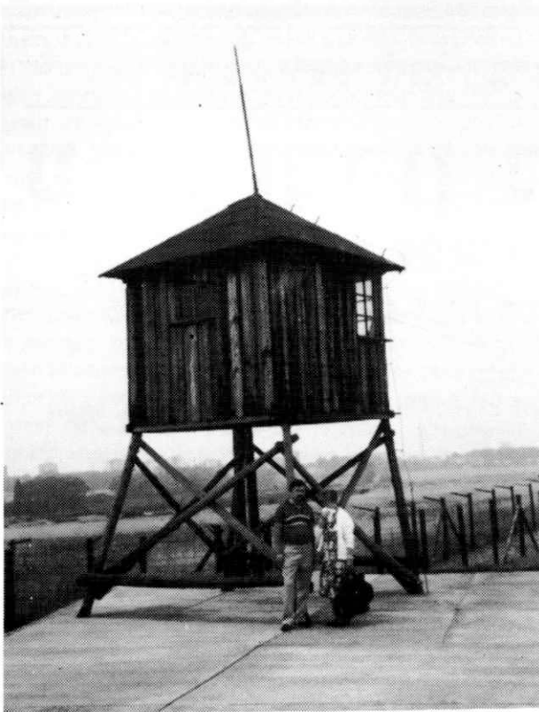
דער וואד־טורעם אין מיידאנק מיגדל שמירה במיידאנק

והרימה סבתא ראשה לשמיים ודמעות זלגו מעיניה כמו מים וחיפשה את כחולי הכנפיים לשוא.