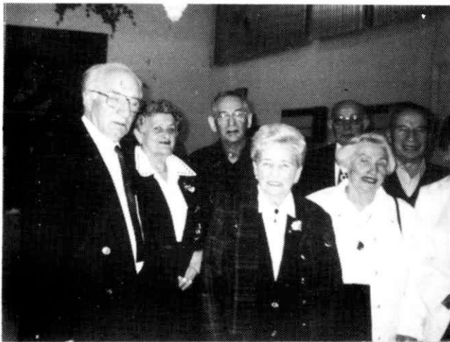
אויף דער יום העצמאות פייערונג אין רמת-גן בנשף יום העצמאות ברמת-גן

ס'איז איצט ערב דעם נייעם יאַר 1997. צום ערשטן מאל, נאָך העכער 30 יאַר, ווי איך האָב נישט באוויזן צוצושיקן א פּערזענלעכן ניי-יאַר ווונטש ערב ראש-השנה, פשוט דערפאַר, ווייל כ'בין אין די חדשים יולי-אויגוסט-סעפטעמבער געלעגן אין שפיטאַל. נוץ איך איצט אויס די געלעגנהייט, כדי דורך דעם "קול לובלין" איבערשיקן די הארציקסטע ניי-יאַר ווונטשן פון א סך געזונט און גליק פאר יעדן לובלינער ייד און זיין משפּחה, אין לאנד און אין אויסלאנד. דערביי וויל איך באדאנקען די אלע וואָס האָבן מיר געשיקט א שנה טובה קארטע, נאַר איך האָב נישט געקענט זיי ענטפערן.