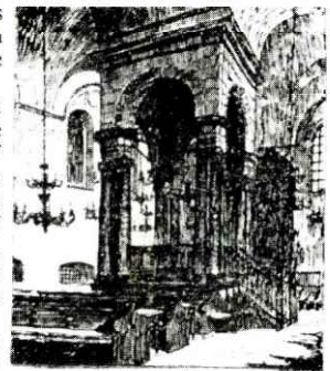
Drawing of the binah of the Maharshal Shul

Many Jewish workers were engaged in the leather industry and in 1939 the biggest leather factory in the city belonged to a Jew and half the employees were Jews. Consequently the trade union of Jewish