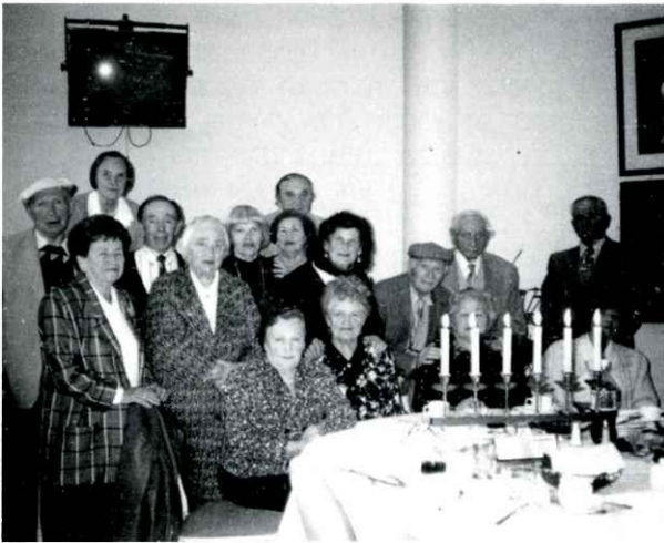
אויף דער יערלעכער אזכרה אין מעלבורן (אויסטראליע) באזכרה השנתית במלבורן (אוסטרליה)

פארבעטונג צו דער אזכרה אין ניו-יאָרק הזמנה לאזכרה בניו-יאָרק