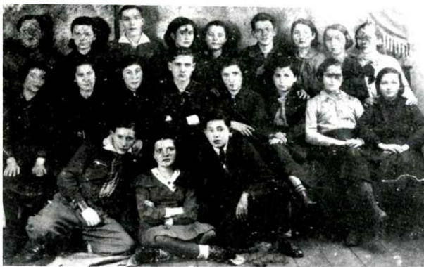
א גרופע חברים פון "יונגבאָר" אין לובלין, 1934 קבוצת חברים של "יונגבאָר" בלובלין, 1934

מיר האָבן געמאַכט א צוזאַמענטרעף מיט דער אַרגאַניזאַציע פון מאַרקושאָוו, א שטעטל ניט ווייט פון לובלין. מיר האָבן זיך געטראַפּן אין א וועלדל לעבן א דערפּל. באַגרייסט זיך: גרייט! - שטענדיק גרייט!