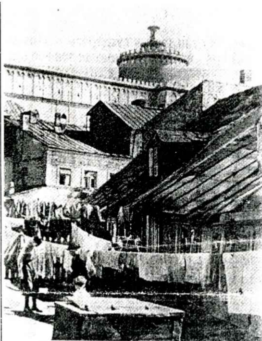
Widok Podzamcza - autor nieznan, reprodukcja z książki p.t. „Żydzi lubelscy” wydawnictwa DABAR, Lublin 1996.

Podzamcze, zwane jeszcze w XIX w. Miastem Żydowskim, zaczęło powstawać pod koniec XV w., na terenie wydzielonym Żydom dla osadnictwa. Centrum tej dzielnicy stanowiła ulica Szeroka, dawniej nazywana także Żydowską. Równoległe do niej powstały ulice Zamkowa (dzisiaj funkcjonuje jako asfaltowy chodnik, biegnący po stoku wzgórza zamkowego) i później Nadstawna oraz Furmańska. Równocześnie z Szeroką pojawiła się także Jateczna, biegnąca poniżej ruin Baszty Żydowskiej, znajdujących się na północnym stoku wzgórza zamkowego. Jateczna szybko, bo już w I poł. XVI w., stała się religijno-duchowym centrum Miasta Żydowskiego. Tu ufundowano Wielką Synagogę Maharszala, zabudowaną