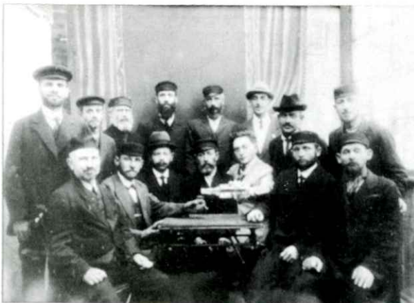
פארוואלטונג פון דער ייד. קהילה אין פילעוו. הוועד של הקהילה היהודית בפולאבי.

אין לובלין איז לעצטנס דערשינען אן אילוסטרירטער פראספעקט אין פויליש און ענגליש "צום אַנדענק פון יידן אין דער לובלינער וואַיעוודסטווע", מיט אייניקע בילדער פון שילן, אינסטיטוציעס, טיפן און געשטאלטן. פאראן דאָרט קורצע באשרייבונגען פון סך-הכל 16 שטעטלעך פון לובלינער ראיאָן, וואָס זייערע נעמען רופן ארויס אָן א שיעור זכרונות, נאַסטאָליע, ראָמאַנטיק און איבערלעבונגען. ווער פון אונדז האָט דען נישט געהאַט א וועלכע ס'איז פארבינדונג מיט די ערטער. איז דאָך לובלין געווען פאר די שטעטלעך ווי א "הויפטשטאָט" אין עקאָנאָמישן, רעליגיעזן, קולטורעלן, משפּחהדיקן, פארטייאישן און געזעלשאפטלעכן זין.