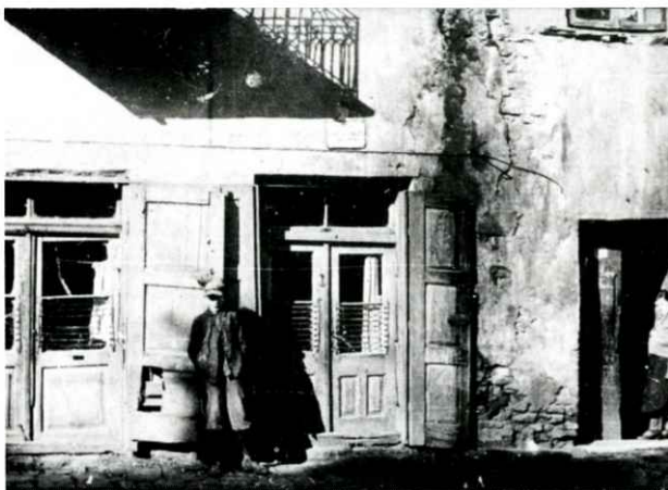
דאָס הייז שעראַקע 28 וווּ ס'האָט געוויינט דער חוזה פון לובלין הבית ברחוב שירוקה 28 ובו התגורר החוזה מלובלין