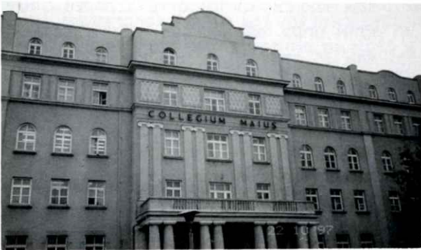
הבנין של ישיבת חכמי לובלין. כעת - אוניברסיטה. די געביידע פון דער געווי ישיבת חכמי לובלין. איצט - אן אוניווערסיטעט.