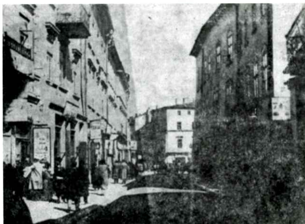
לובלין, בראַמאַוואַ-גאַס 1924. דאָ האָט זיך אָנגעהויבן דער יידישער קוואַרטאַל. לובלין, רחוב ברמובה, 1924. כאן התחיל הרובע היהודי.