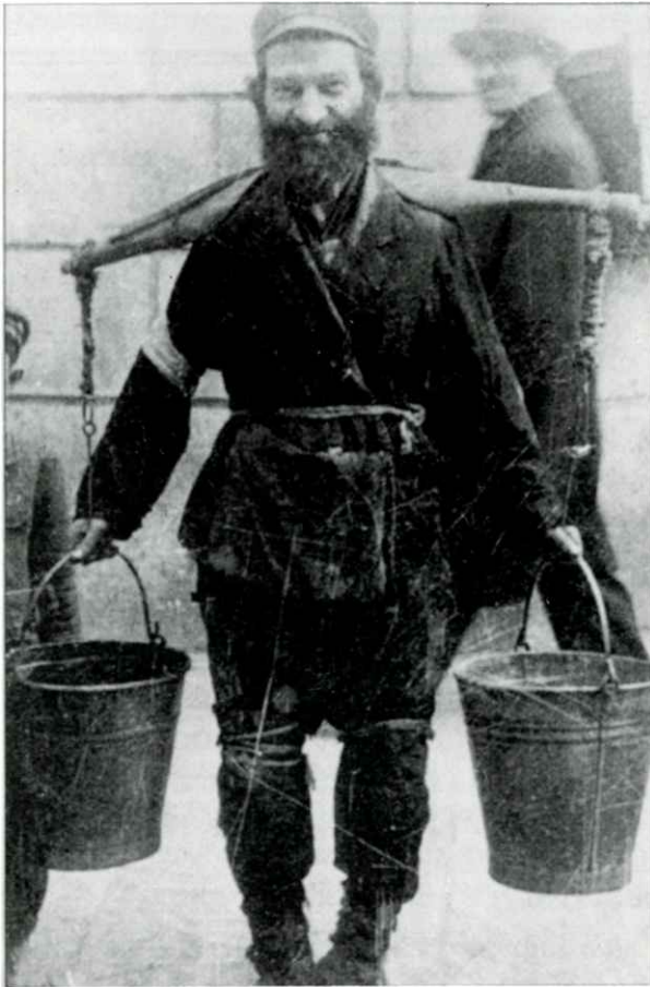
א וואסערטרגער אין פיוסק, נושא מים בפיוסקי.