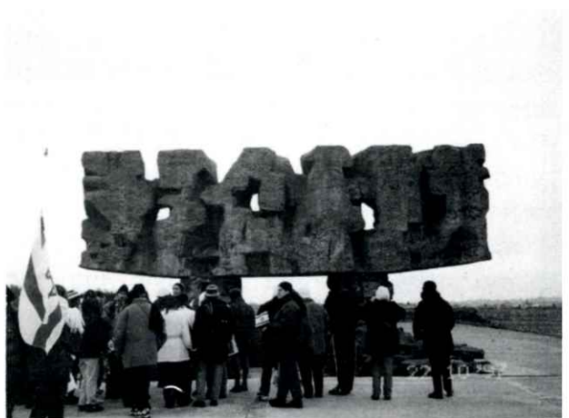
הכניסה למחנה ההשמדה מיידנק. אריינגאנג אין פארניכטונג - לאגער מיידאנעק.