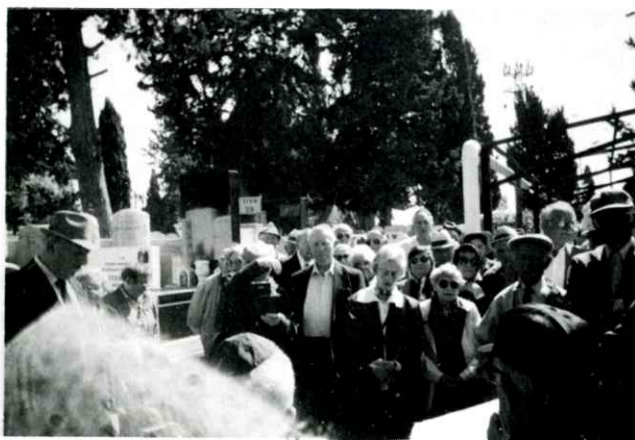
אויף דער אזכרה אין נחלת יצחק, אפריל 1998 באזכרה בבית הקברות נחלת יצחק, אפריל 1998

ענדע פעברואר האָט זיך דערוויסט די סעקרעטארין פון קאמיטעט, אז עס דארף קומען קיין ישראל א בכבודיקע דעלעגאציע פון לובלין: דער פארטרעטער פון שטאָט-פרעזידענט, דער פרעזידענט פון שטאָטראט, אין דער וואָרטזאָגער פון שטאָט. די דעלעגאציע איז געווען פארבעטן פון ראשון-לציון, וועלכע איז די צוויילינגשטאָט פון לובלין. זיי זענען געווען נאָר 7 טעג און ישראל. ס'איז געווען שווער צו אָרגאניזירן דעם צוזאמענטרעף. נאָך גרויסע באמיואנגען,