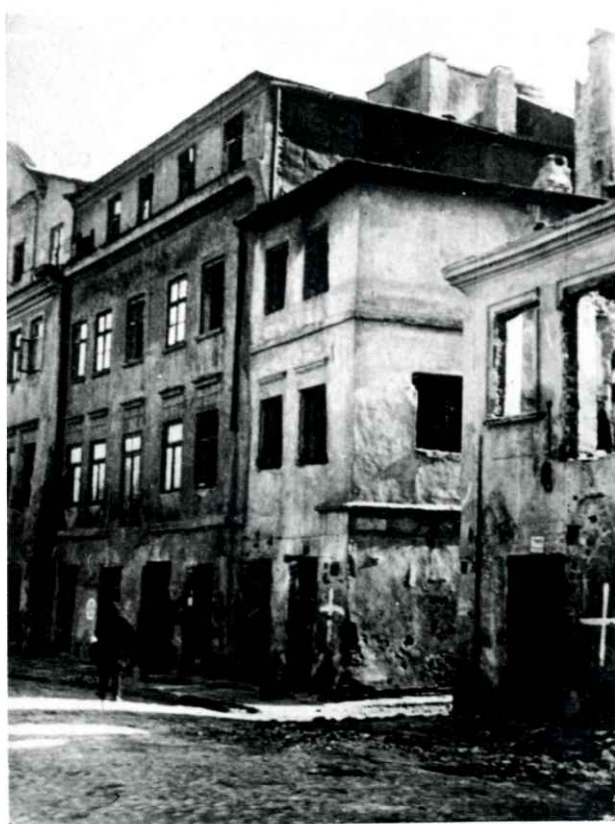
אזוי האָט אויסגעזען אַ הויז אויף שיראַקע אין 1942 מראה הבית ברחוב שירוקה בשנת 1942

און דער זון פון דער גוטהאַרציקער פרוי האָט אָפּגענומען דעם מעדאַל פון "חסידי אומות העולם" אין וואַרשע, פון די הענט פון ישראל אַמבאַסאַדאָר אין פּוילן.