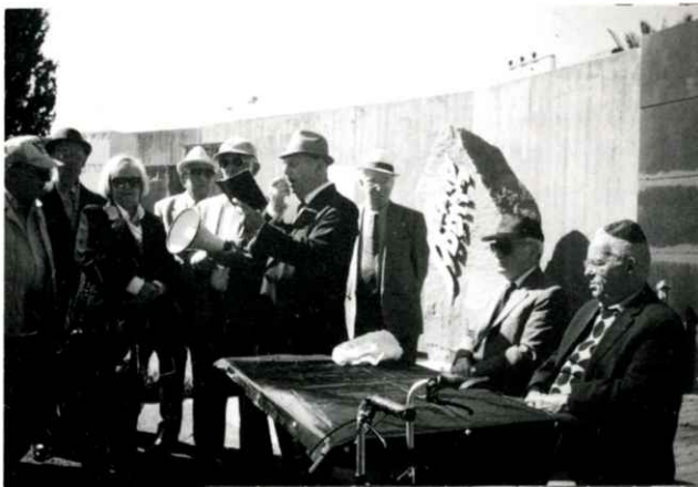
די אזכרה אין נחלת יצחק אין טאָג פון אומקום און גבורה האזכרה ביום השואה והגבורה בנחלת יצחק