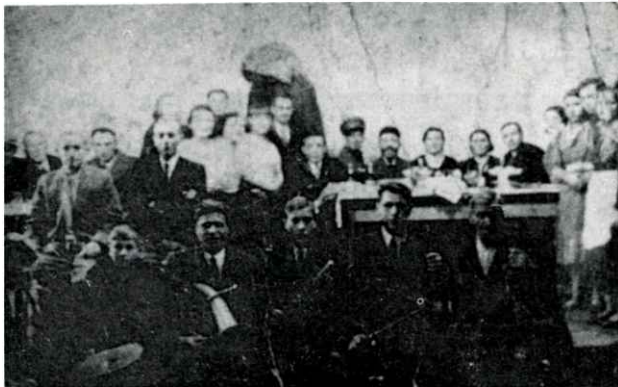
א יידישע חתונה אין פיוסק. חתונה יהודית בפיוסק.