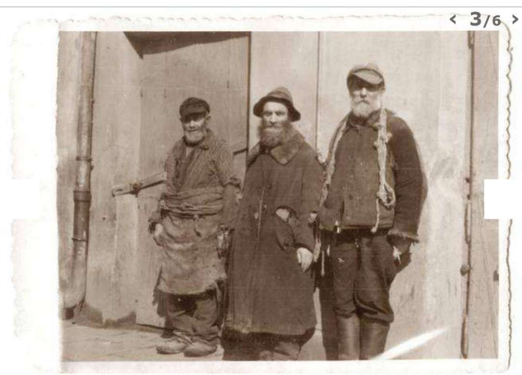
(© Teatr NN)