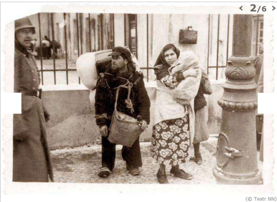
(© Teatr NN)