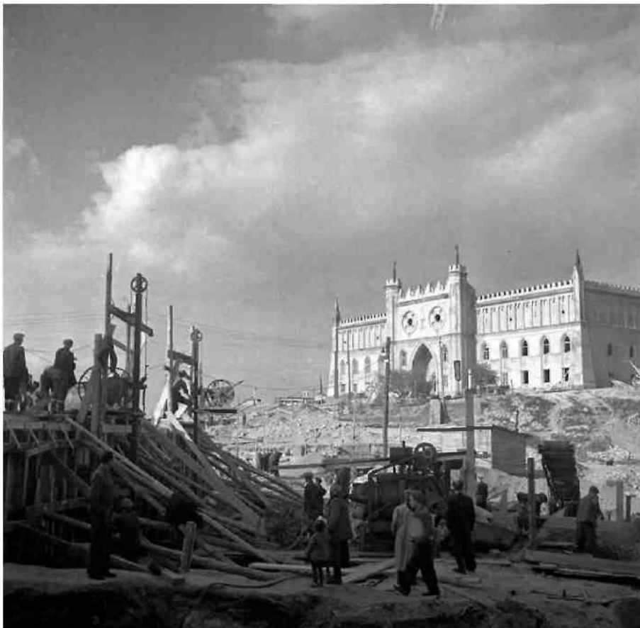
Ośrodek Brama Grodzka-Teatr NN

W tym czasie, na gruzach wyburzonej przez hitlerowców dzielnicy żydowskiej powstał Plac Zebrań Ludowych, czyli dzisiejszy plac Zamkowy.