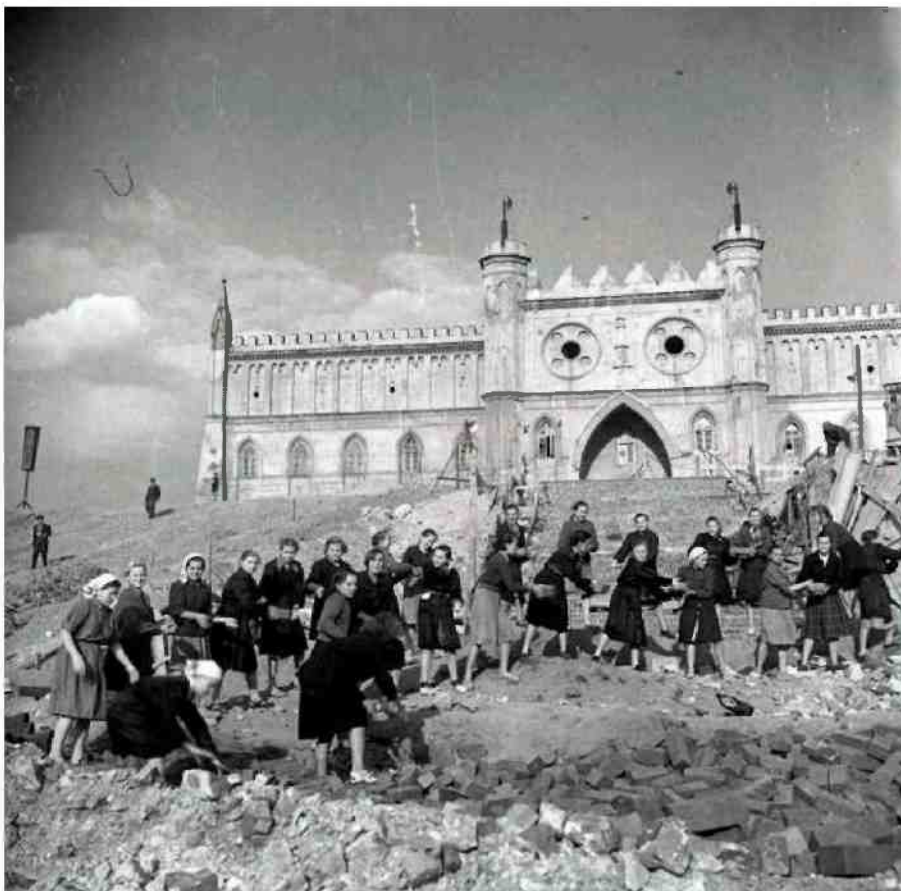
Ośrodek Brama Grodzka-Teatr NN

Tak wyglądało porządkowanie okolic zamku z gruzu w czynie społecznym.