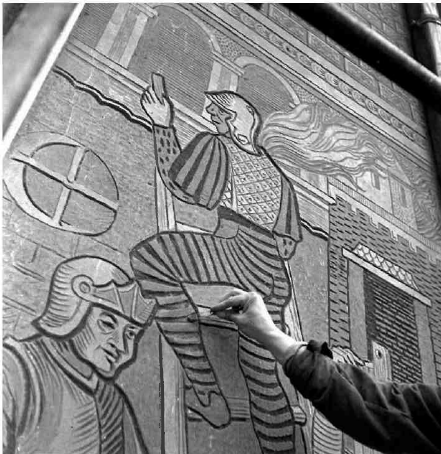
Ośrodek Brama Grodzka-Teatr NN

Prace utrudniał brak archiwum konserwatorskiego, które zostało wywiezione przez Niemców i odnalezione dopiero w niewielkiej części w 1967 r. w Opolu.