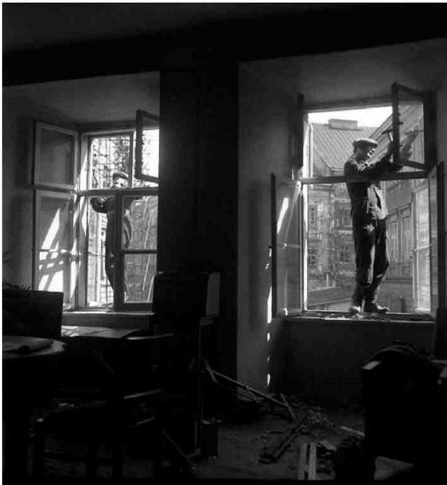
Ośrodek Brama Grodzka-Teatr NN

'Lubelska Starówka' to jeden z kilkunastu filmów 'Czarnej serii' polskiej szkoły dokumentu. Jej twórcy zerwali z propagandą obecną w kronice filmowej.