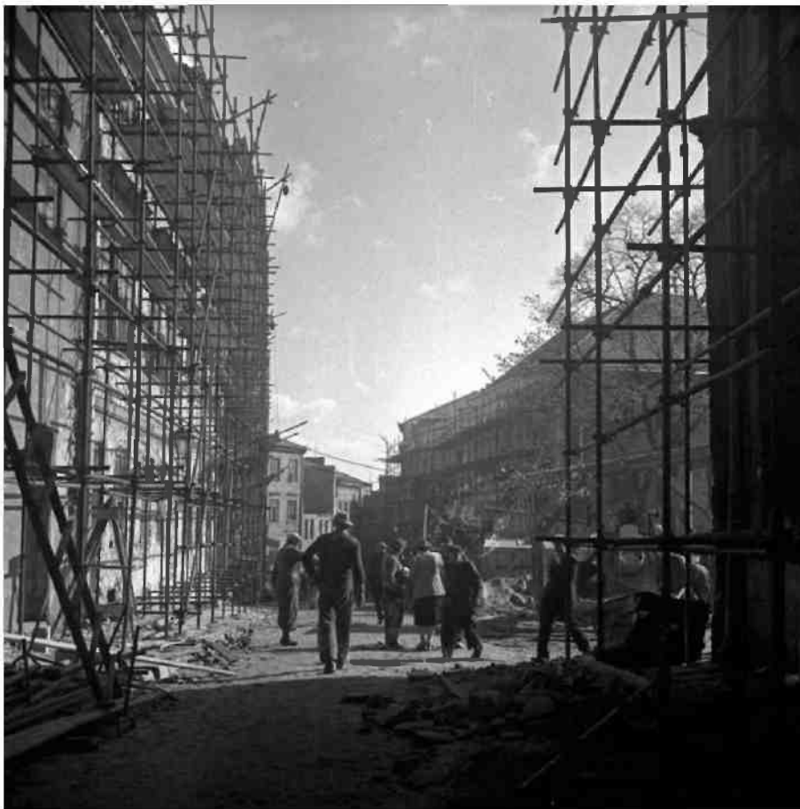
Ośrodek Brama Grodzka-Teatr NN

Na zdjęciach widać odbudowę zbombardowanego w 1939 r. fragmentu Lublina i renowację ocalałych obiektów.