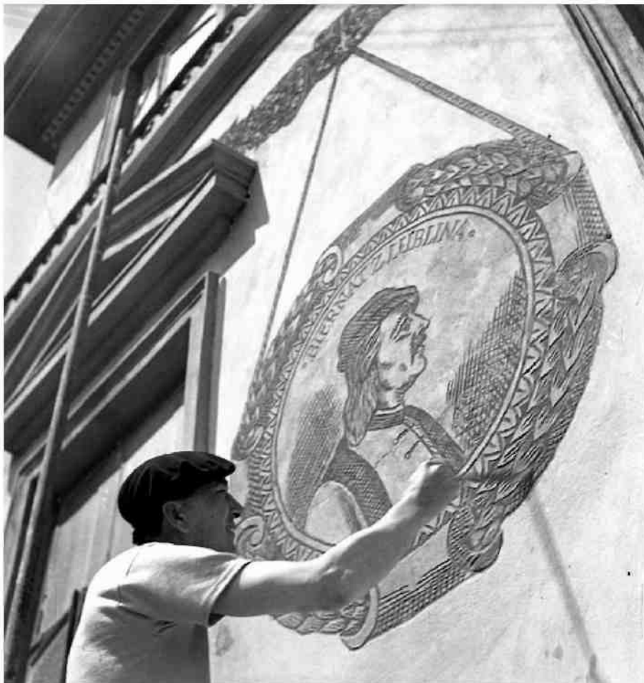
Ośrodek Brama Grodzka-Teatr NN

Największe nasilenie renowacji to kilka miesięcy przed lipcem 1954 roku, w związku z przypadającym jubileuszem X-lecia PRL. Remont objął wszystkie kamienice w Rynku, ul. Grodzkiej i Złotej, odbudowano także Bramę Rybną. Ale prace ograniczały się głównie do prac elewacyjnych - rekonstruowano attyki i elewacje kamienic dekorowano sgraffitami nawiązując do renesansowego sposobu zdobienia.