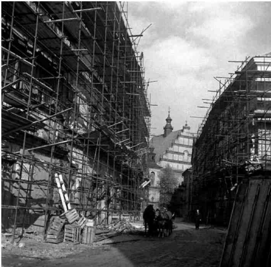
Ośrodek Brama Grodzka-Teatr NN

Pomimo ogromnej krytyki prac na X-lecie PRL trzeba przyznać, że uporządkowano wtedy główne ulice Starego Miasta. Na zdjęciu ul. Złota.