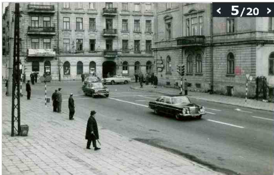
Opis: 21 wrzesień 1969. Lublin, ul. Lipowa róg Krak. Przedm. Przejazd delegacji na otwarciu pomnika na Majdanku