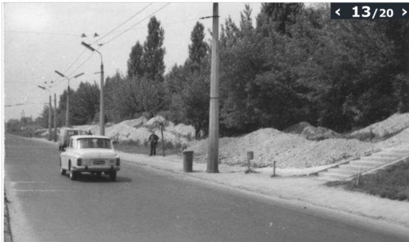
17 czerwca 1969 r., ul. PKWN, rozkopy w pasie trawnikowym