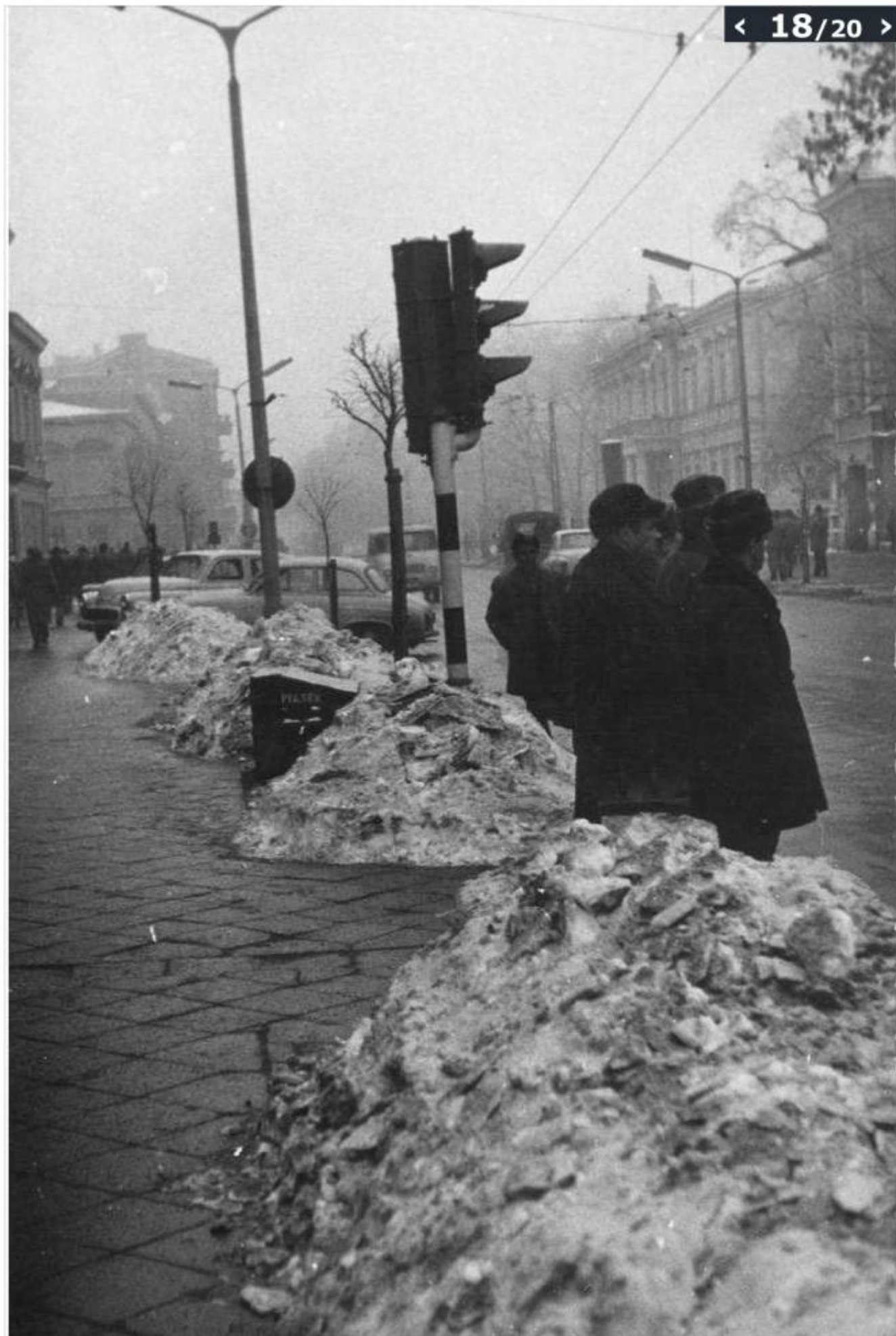
Styczeń 1971, ul. Krak. Przedmieście; [brak autora zdjęcia]