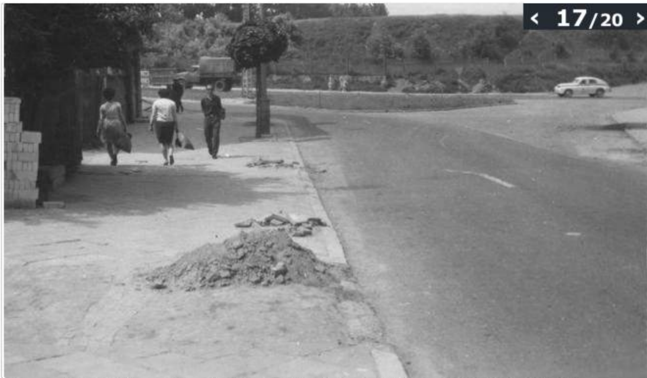
17 czerwca 1969, ul. Króla Leszczyńskiego (róg ul. Czechowskiej), zaśmiecenie chodnika przez WBP; Fot. Marian Budzyński (© Zdjęcie pochodzi z Archiwum Fotografii Teatru NN)