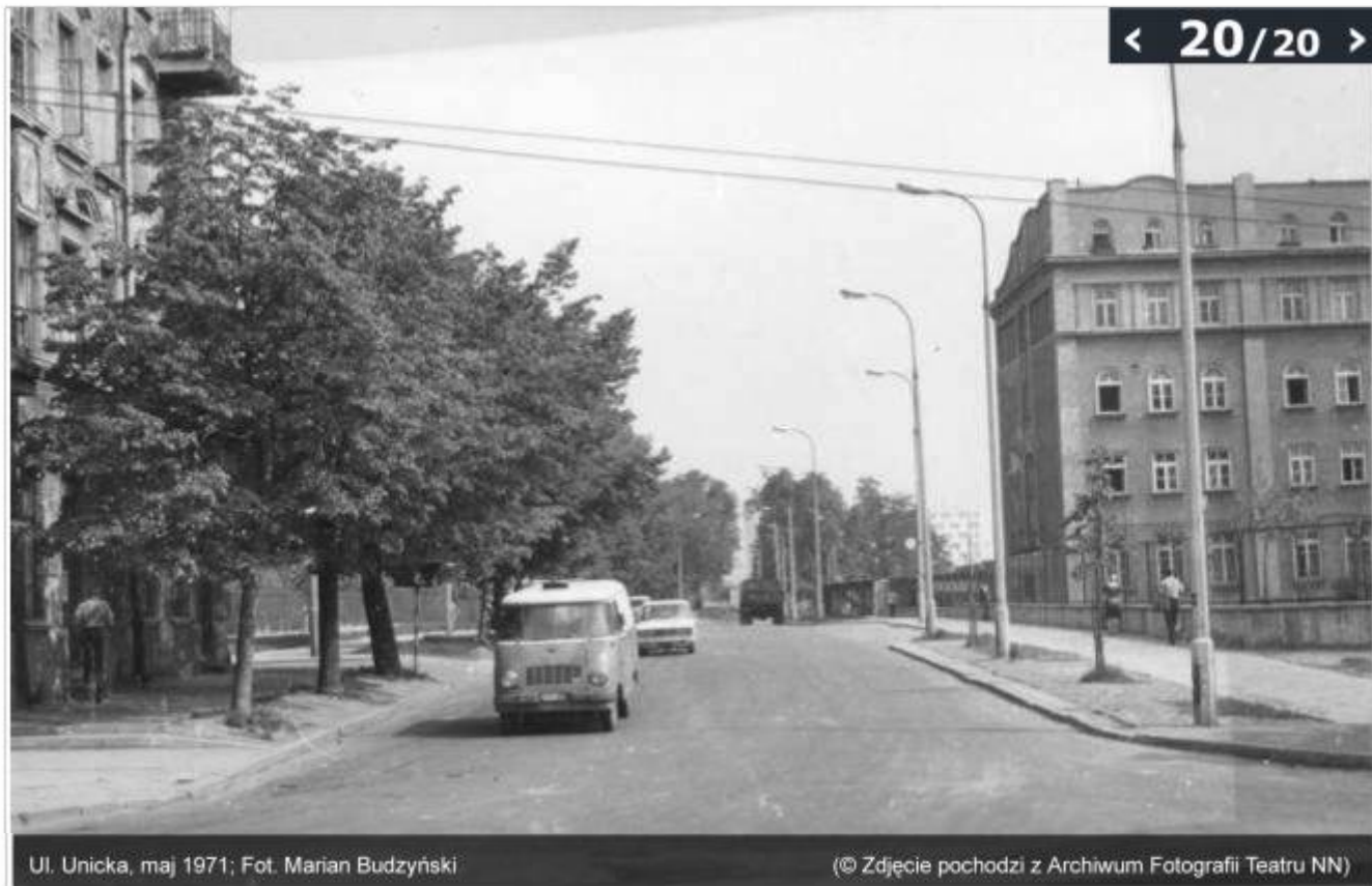
Ul. Unicka, maj 1971