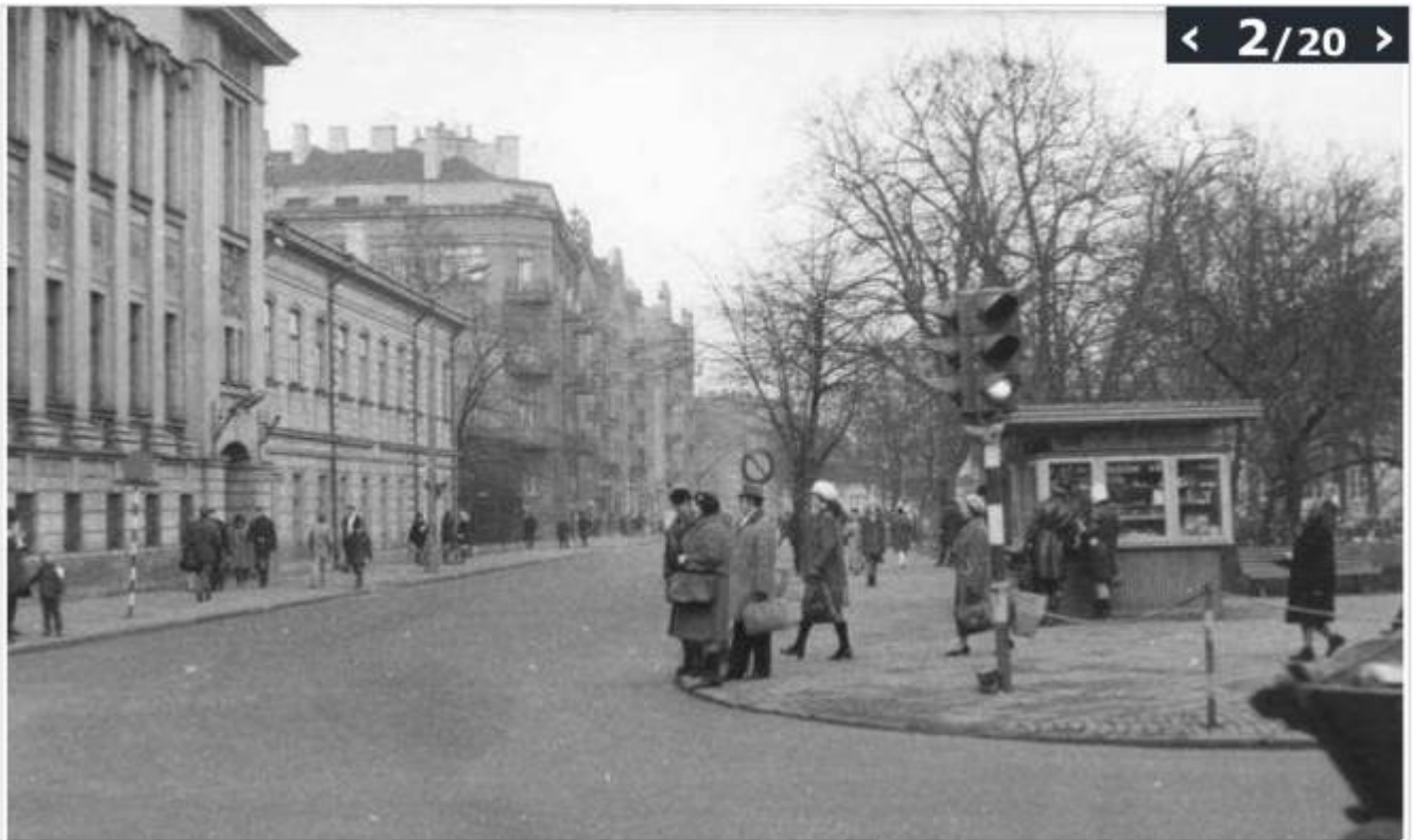
1 luty 1971, ul. 3 Maja