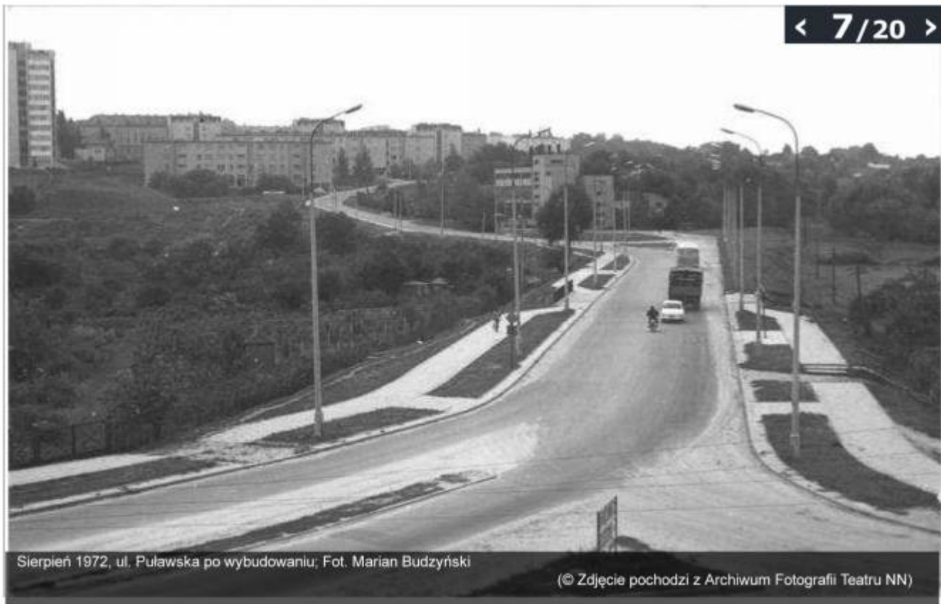
Sierpień 1972, ul. Puławska po wybudowaniu; Fot. Marian Budzyński

(© Zdjęcie pochodzi z Archiwum Fotografii Teatru NN)