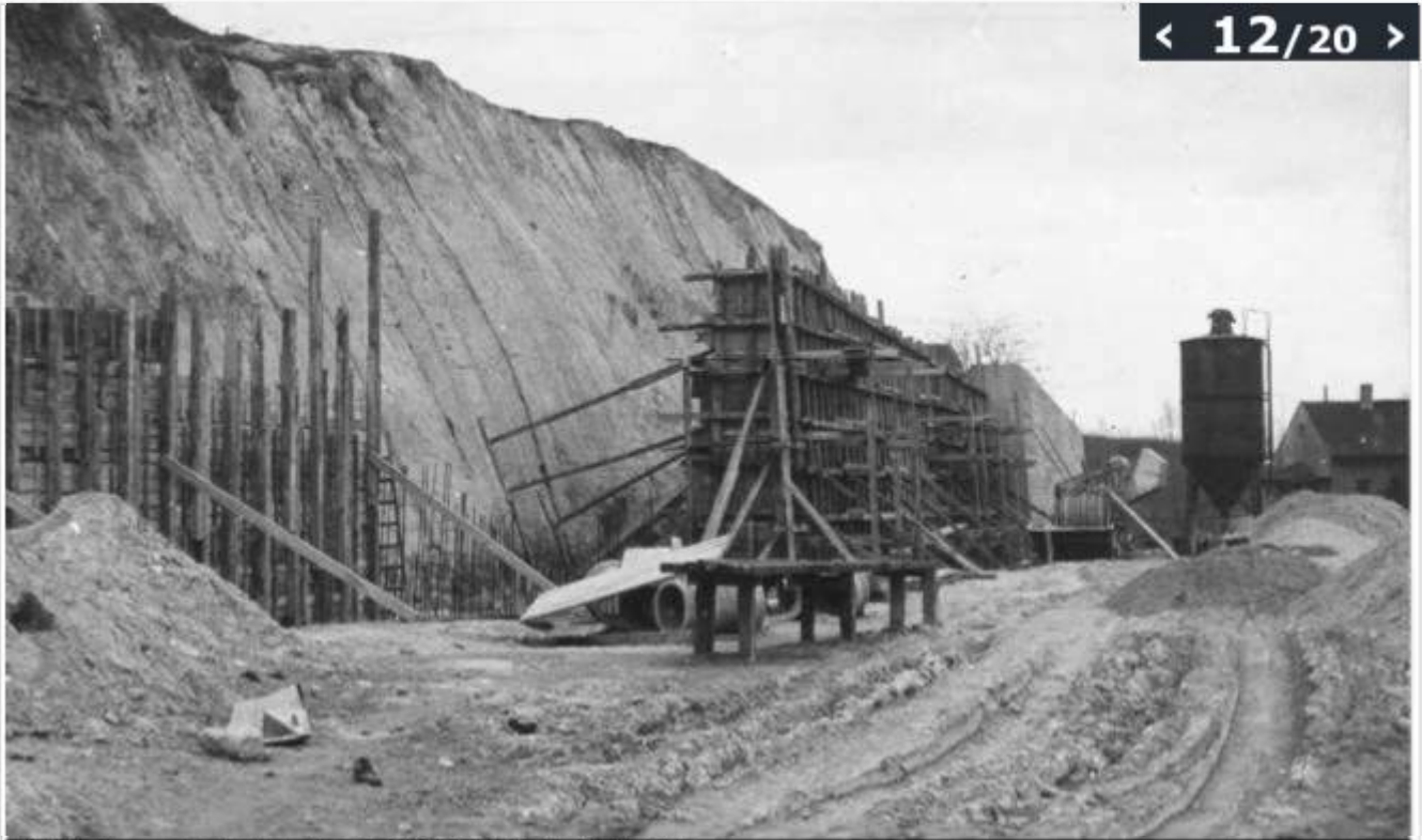
Ul. Ruska w czasie budowy, kwiecień 1971