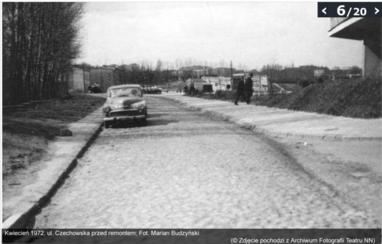
Kwiecień 1972, ul. Czechowska przed remontem; Fot. Marian Budzyński

(© Zdjęcie pochodzi z Archiwum Fotografii Teatru NN)