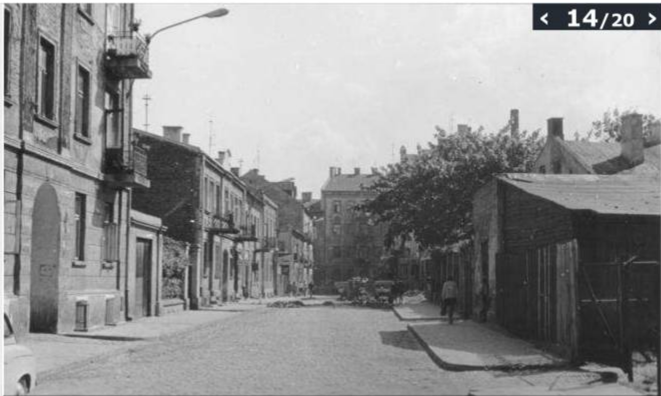
Ul. Orla, maj 1971; Fot. Marian Budzyński

(© Zdjęcie pochodzi z Archiwum Fotografii Teatru NN)