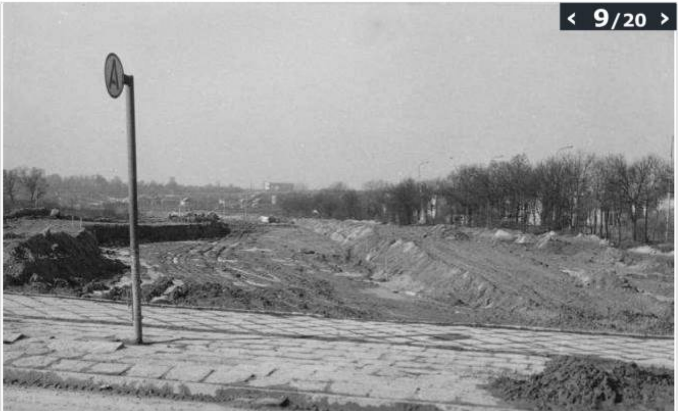
[brak opisu zdjęcia]