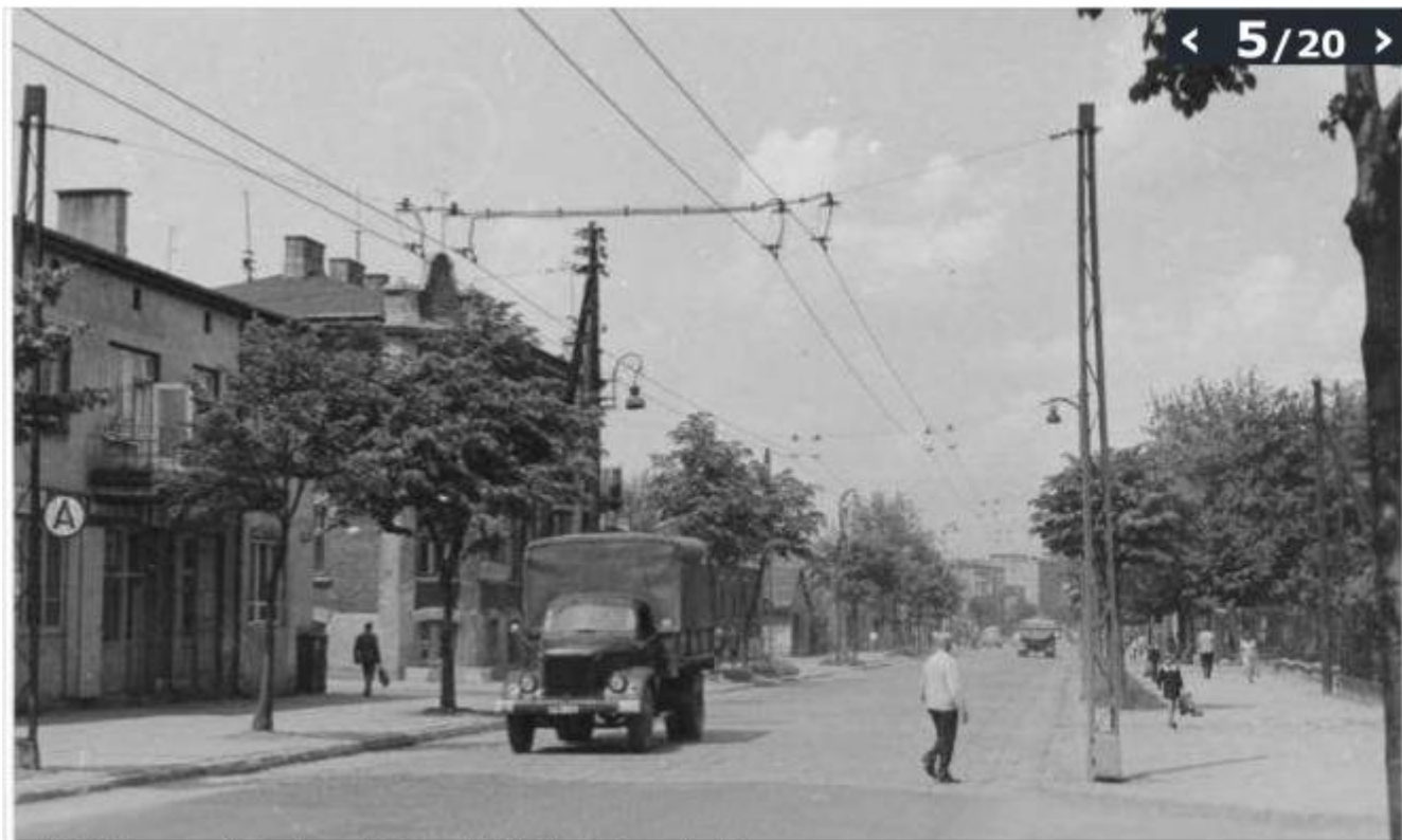
ul. Kunickiego na odc. Krańcowa-Piękna, maj 1971; [brak autora zdjęcia]