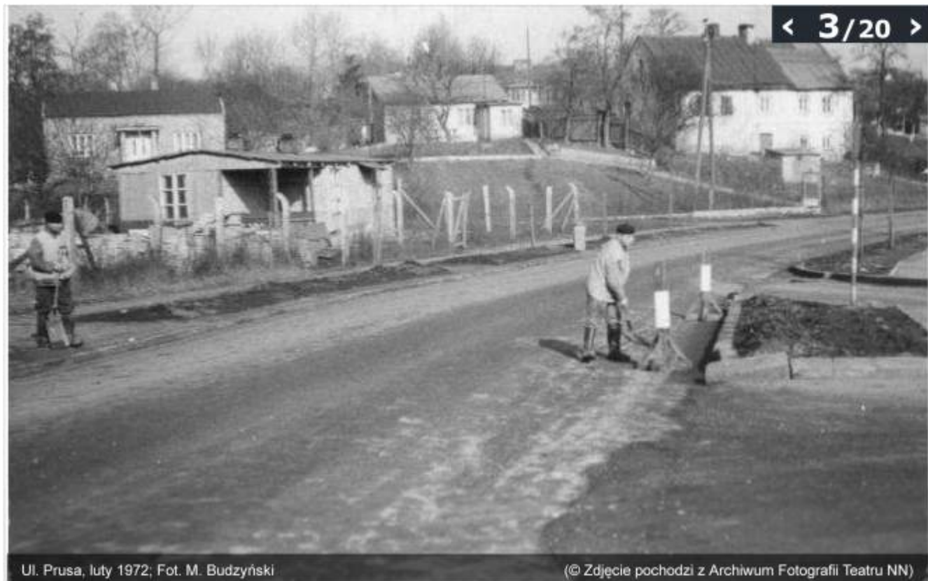
Ul. Prusa, luty 1972; Fot. M. Budzyński

(© Zdjęcie pochodzi z Archiwum Fotografii Teatru NN)