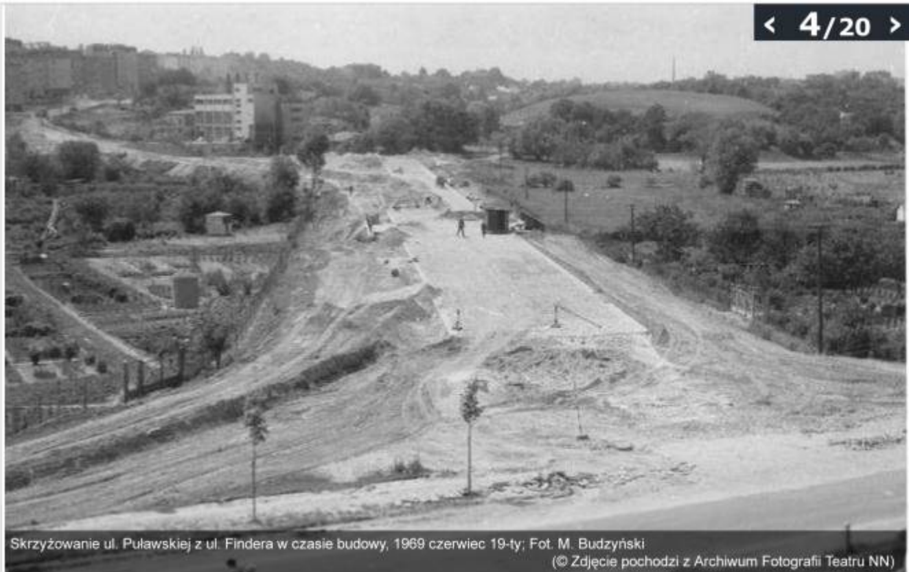
Skrzyżowanie ul. Puławskiej z ul. Findera w czasie budowy, 1969 czerwiec 19-ty