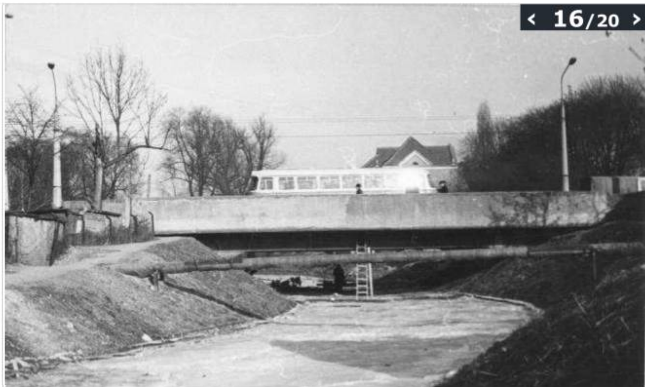
8.II.1969 r., Most na ulicy Armii Czerwonej przed przebudową; Fot. Marian Budzyński

(© Zdjęcie pochodzi z Archiwum Fotografii Teatru NN)