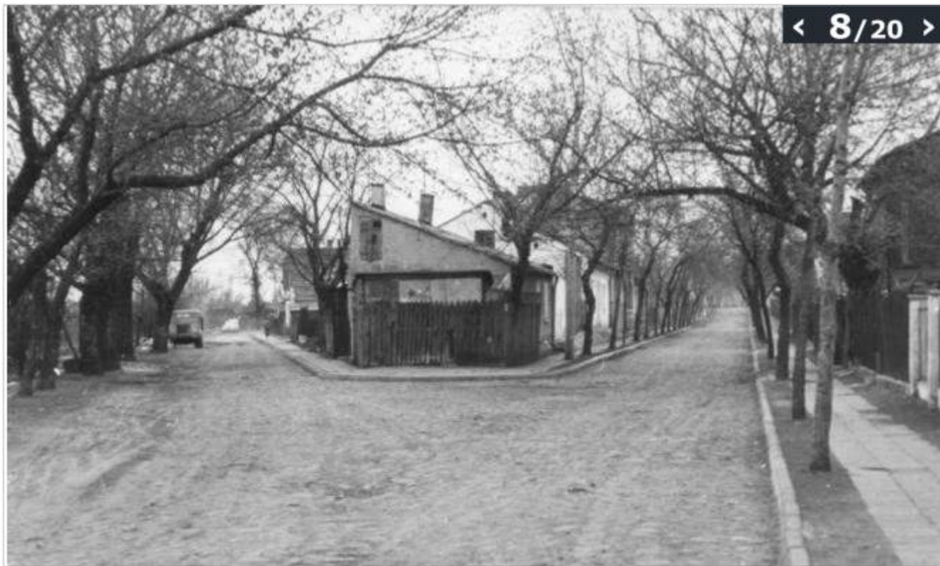
Ul. Ciepła i ul. Radzikowska (za Cukrownią), kwiecień 1971; Fot. Marian Budzyński

(© Zdjęcie pochodzi z Archiwum Fotografii Teatru NN)