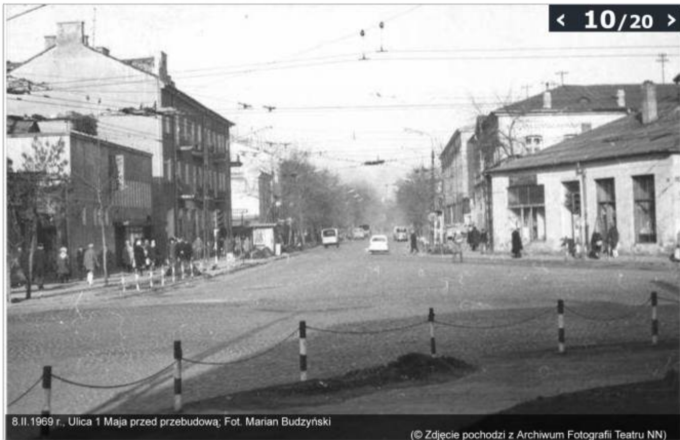
8.II.1969 r., Ulica 1 Maja przed przebudową