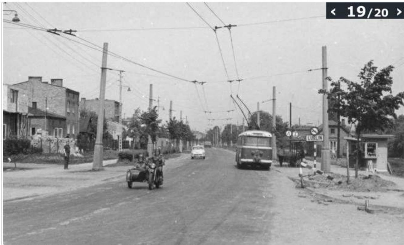
Maj 1971, ul. Kunickiego przy ul. Gluskiej