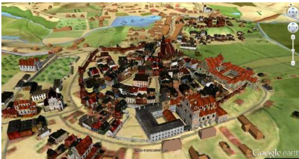
Makieta Lublina z XVIII wieku, za stroną www.przewodniki.teatrnn.pl

Małgorzata Szlachetka | 24.01.2012 , aktualizacja: 24.01.2012 18:56