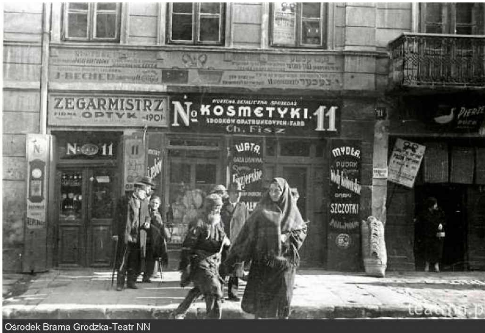
Ośrodek Brama Grodzka-Teatr NN