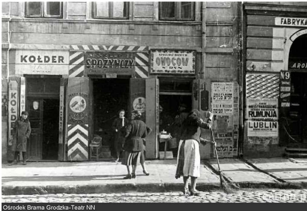
Ośrodek Brama Grodzka-Teatr NN