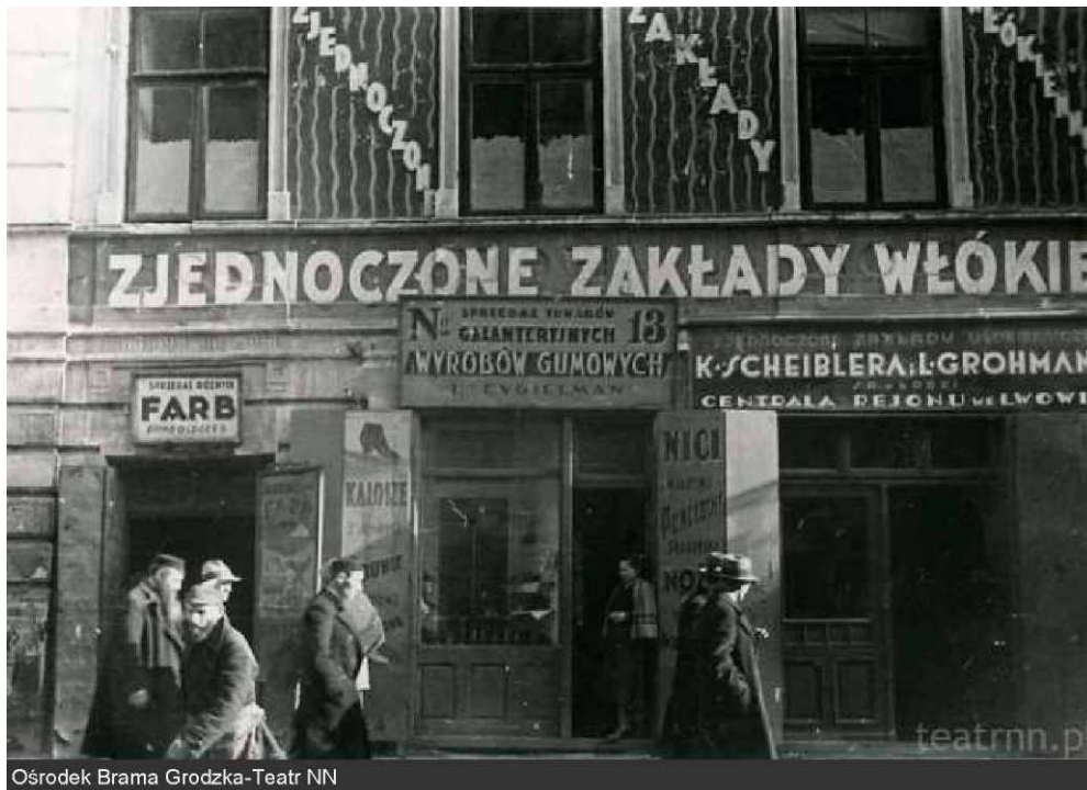
Ośrodek Brama Grodzka-Teatr NN