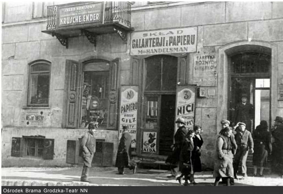
Ośrodek Brama Grodzka-Teatr NN