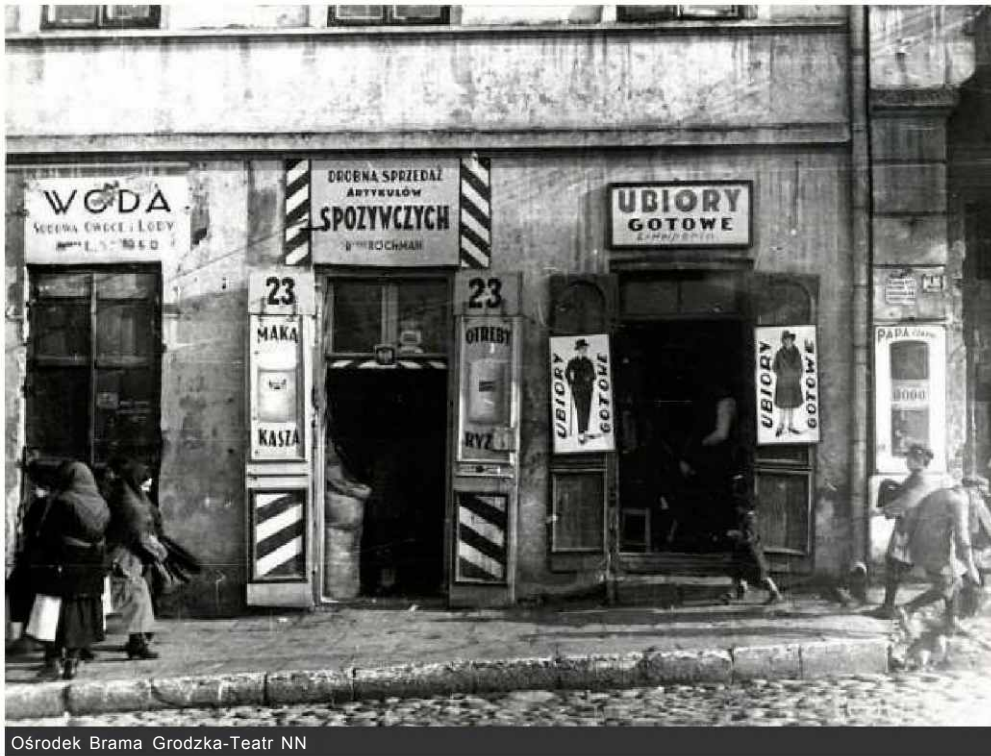
Ośrodek Brama Grodzka-Teatr NN