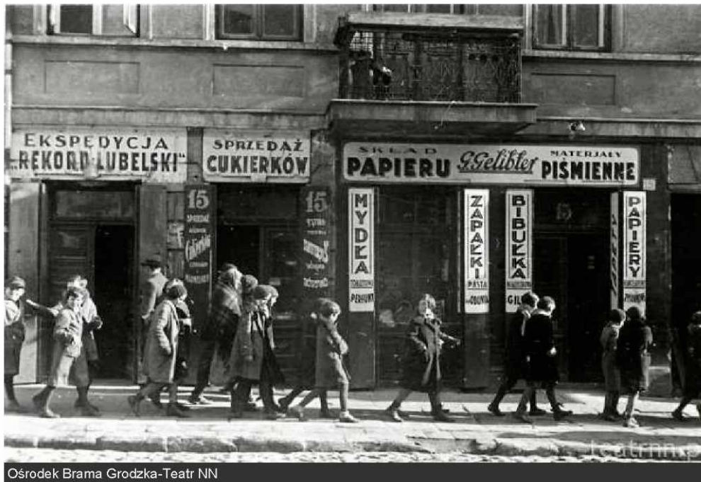
Na zdjęciu dawna Lubartowska 15. Powojenny adres tego budynku to nr 41. Dziś już nie istnieje.