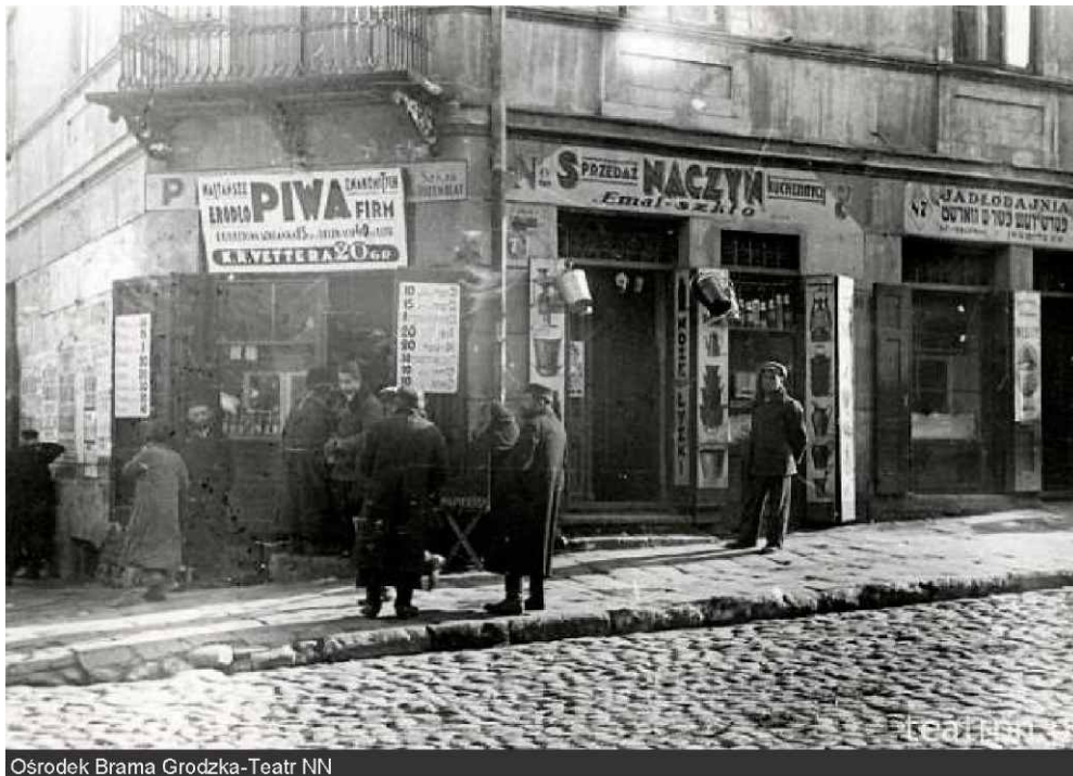
Ośrodek Brama Grodzka-Teatr NN