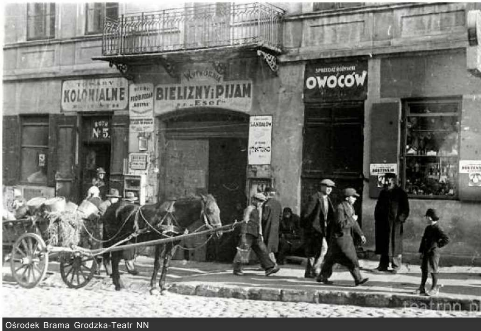
Ośrodek Brama Grodzka-Teatr NN