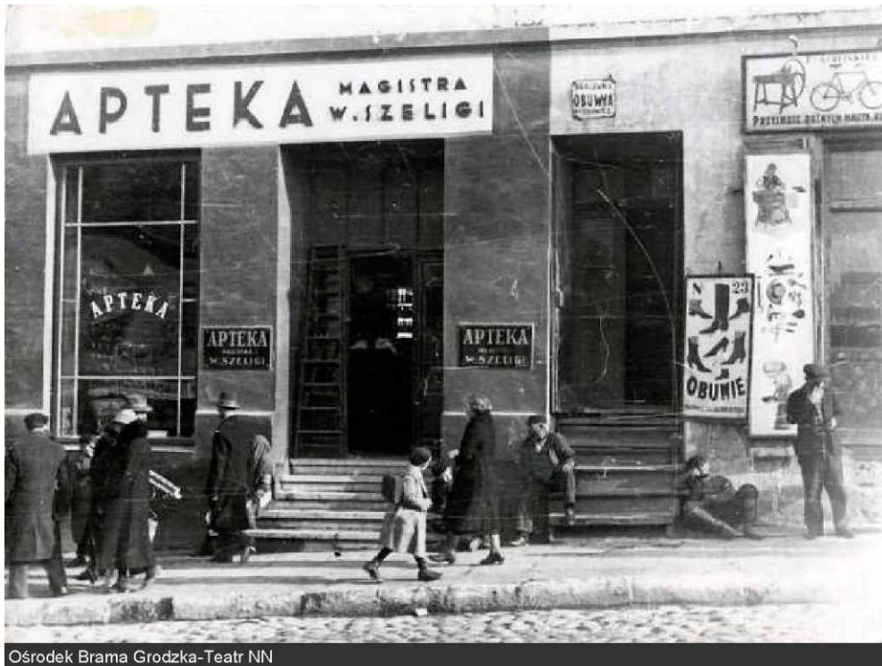
Ośrodek Brama Grodzka-Teatr NN