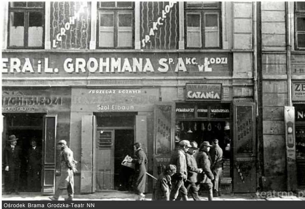
Ośrodek Brama Grodzka-Teatr NN