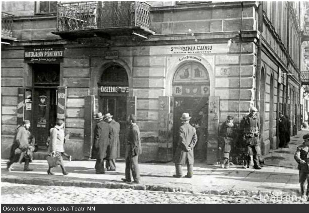
Ośrodek Brama Grodzka-Teatr NN