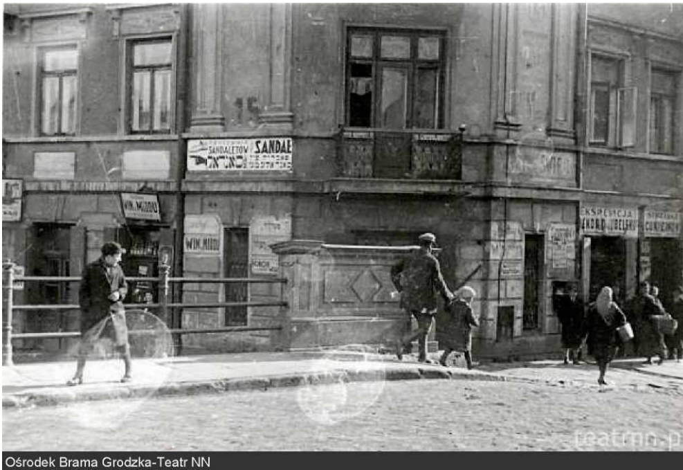
Ośrodek Brama Grodzka-Teatr NN

Na zdjęciu widać mostek na rzece Czechówce.