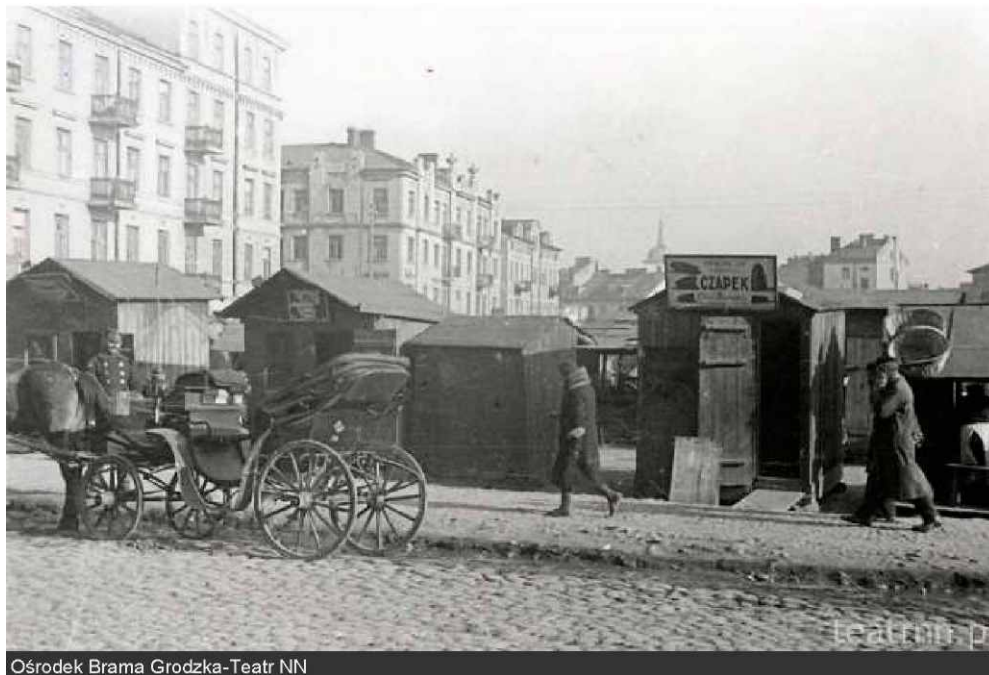
Ośrodek Brama Grodzka-Theatr NN

Dziś w tym miejscu znajduje się sklep 'Bazar'.