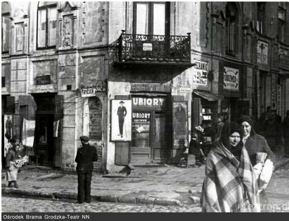
Ośrodek Brama Grodzka-Teatr NN

Dawna ul. Nowa 21, dzisiejsza Lubartowska 21