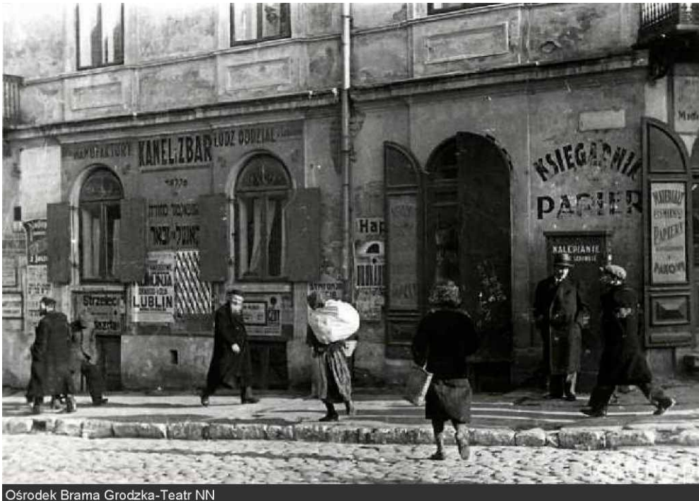
Ośrodek Brama Grodzka-Teatr NN