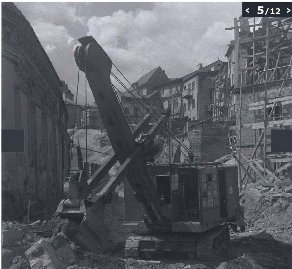
Galeria zdjęć z odbudowy Starego Miasta w Lublinie wykonanych przez Edwarda Hartwiga.

(© Zdjęcie pochodzi z Archiwum Fotografii Teatru NN)