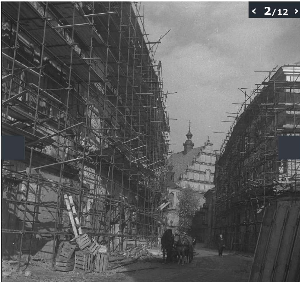
Galeria zdjęć z odbudowy Starego Miasta w Lublinie wykonanych przez Edwarda Hartwiga.

(© Zdjęcie pochodzi z Archiwum Fotografii Teatru NN)