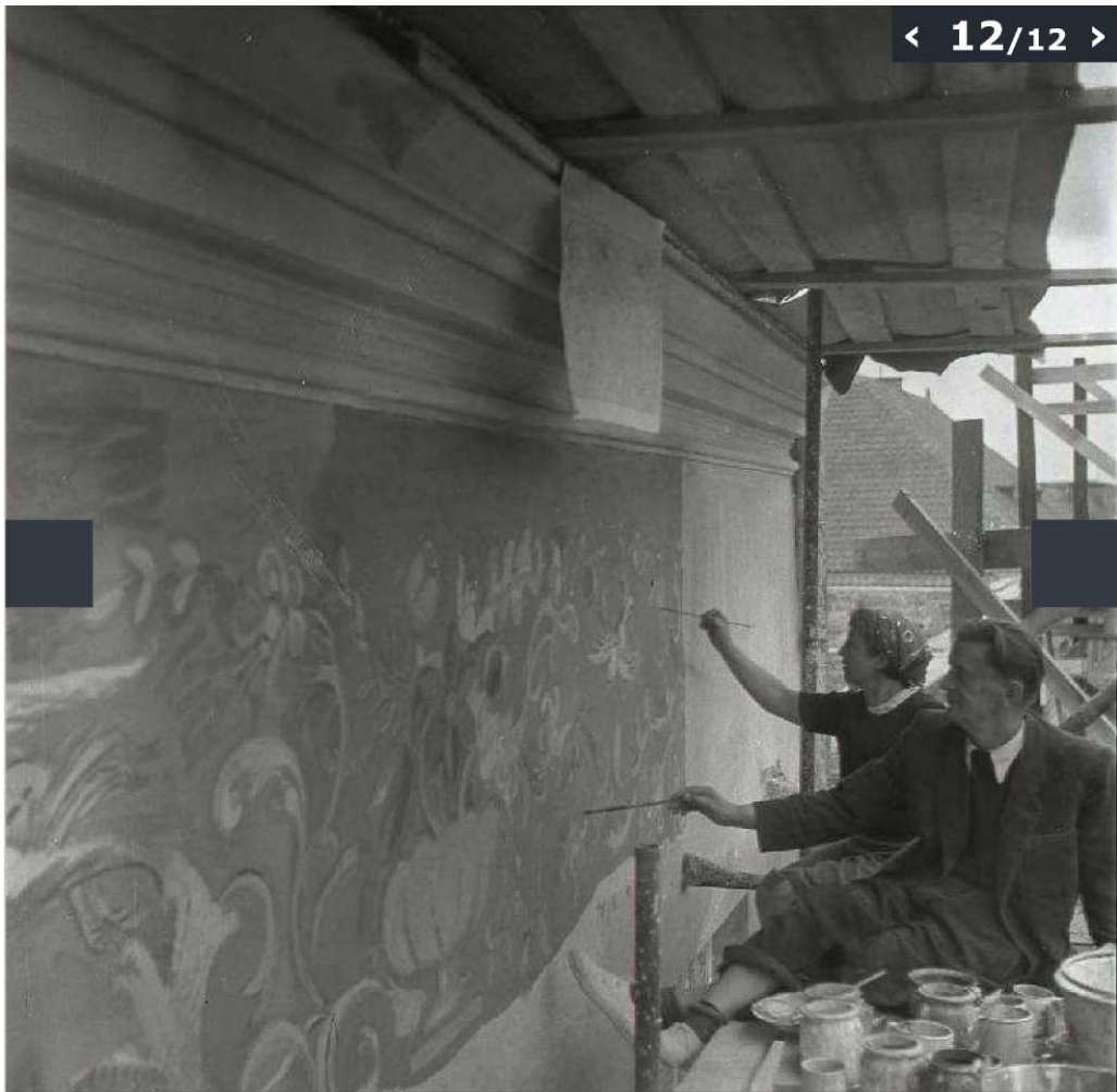
Galeria zdjęć z odbudowy Starego Miasta w Lublinie wykonanych przez Edwarda Hartwiga.