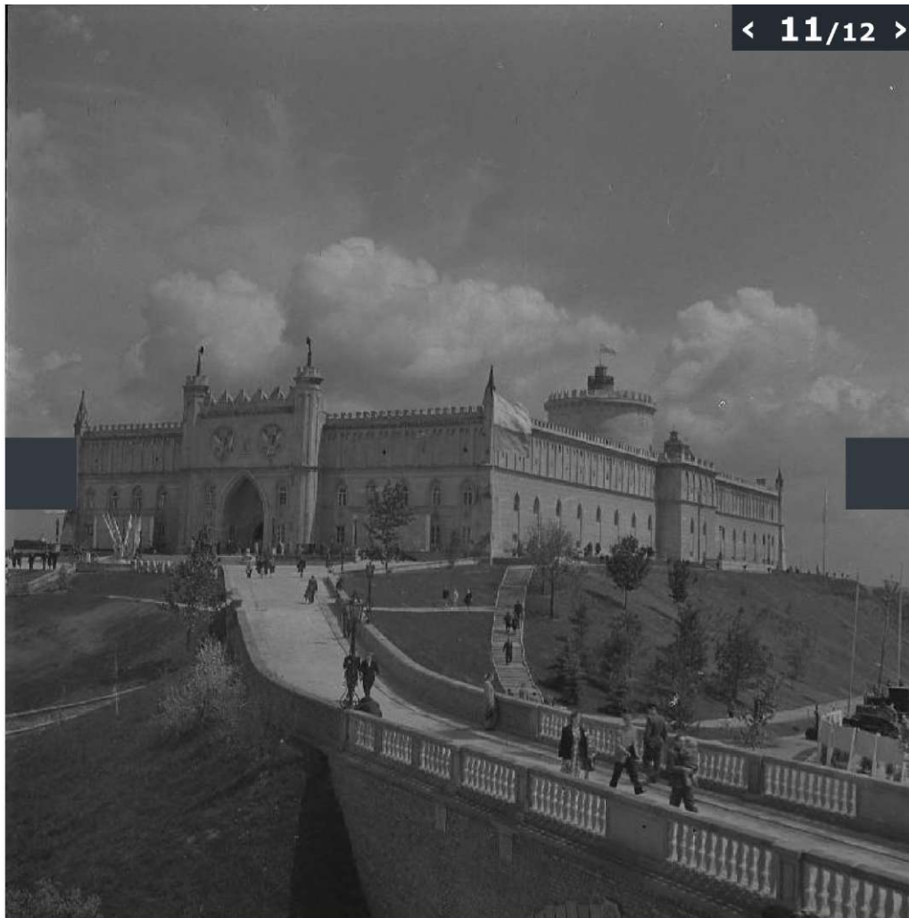
Galeria zdjęć z odbudowy Starego Miasta w Lublinie wykonanych przez Edwarda Hartwiga.

(© Zdjęcie pochodzi z Archiwum Fotografii Teatru NN)