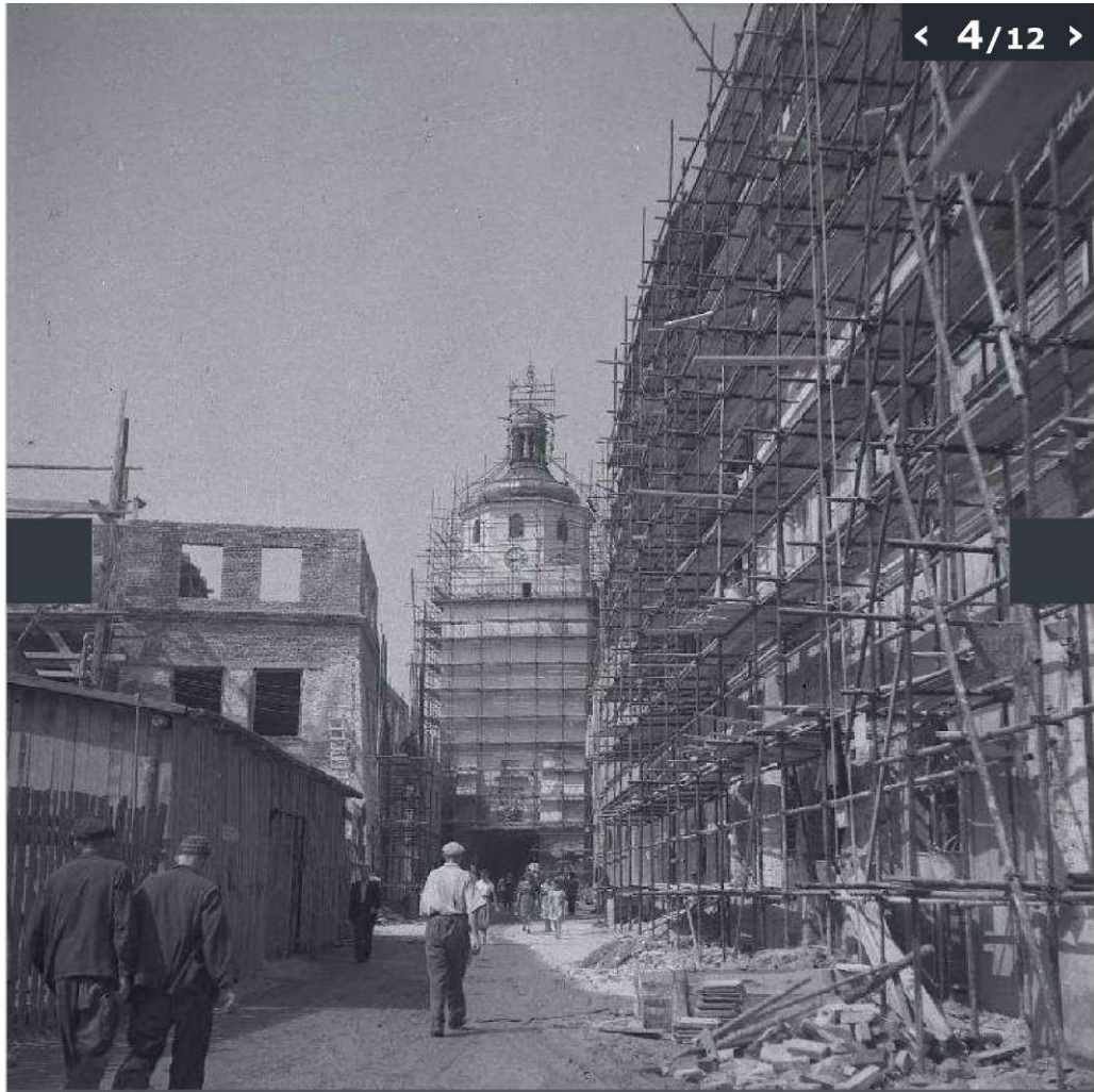
Galerya zdjęć z odbudowy Starego Miasta w Lublinie wykonanych przez Edwarda Hartwiga.

(© Zdjęcie pochodzi z Archiwum Fotografii Teatru NN)