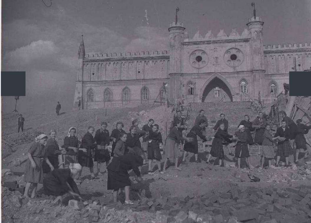
Galeria zdjęć z odbudowy Starego Miasta w Lublinie wykonanych przez Edwarda Hartwiga.

(© Zdjęcie pochodzi z Archiwum Fotografii Teatru NN)