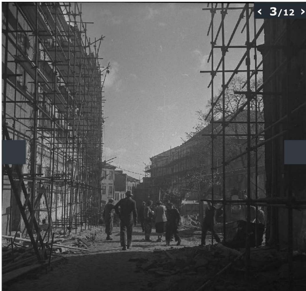
Galeria zdjęć z odbudowy Starego Miasta w Lublinie wykonanych przez Edwarda Hartwiga.

(© Zdjęcie pochodzi z Archiwum Fotografii Teatru NN)