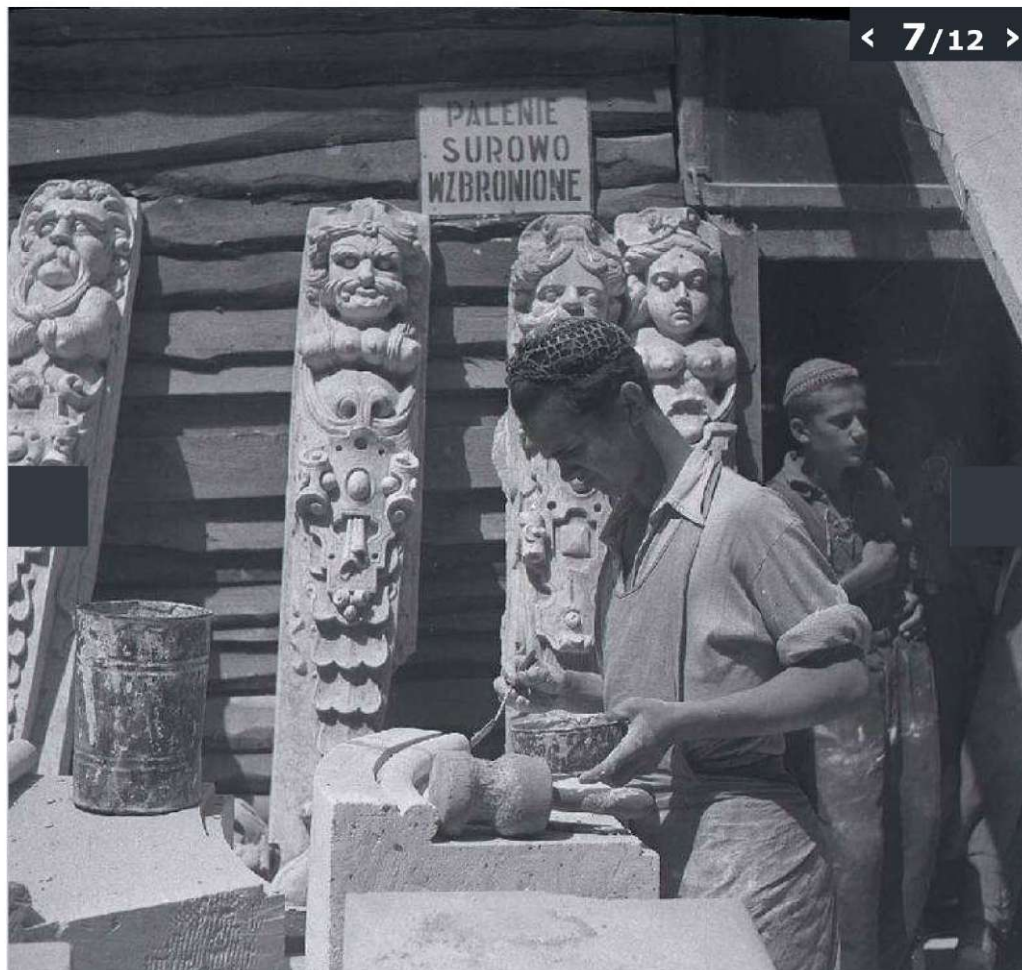
Galeria zdjęć z odbudowy Starego Miasta w Lublinie wykonanych przez Edwarda Hartwiga.

(© Zdjęcie pochodzi z Archiwum Fotografii Teatru NN)