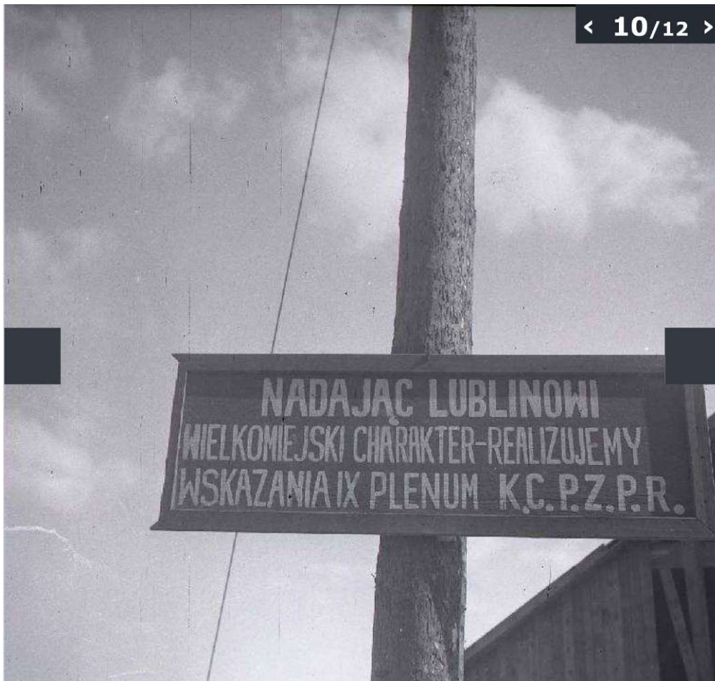
Galeria zdjęć z odbudowy Starego Miasta w Lublinie wykonanych przez Edwarda Hartwiga.