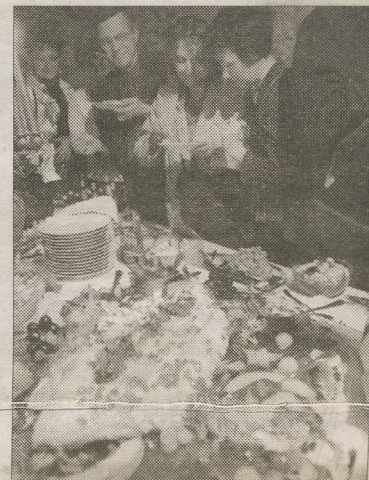
Rejowy poczęstunek przygotowany przez Piwnicę Rycerską i Dwór Anna