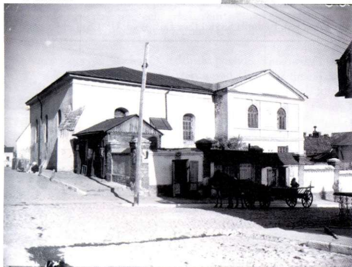
Stara synagoga w Chełmie