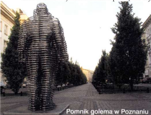
Pomnik golema w Poznaniu