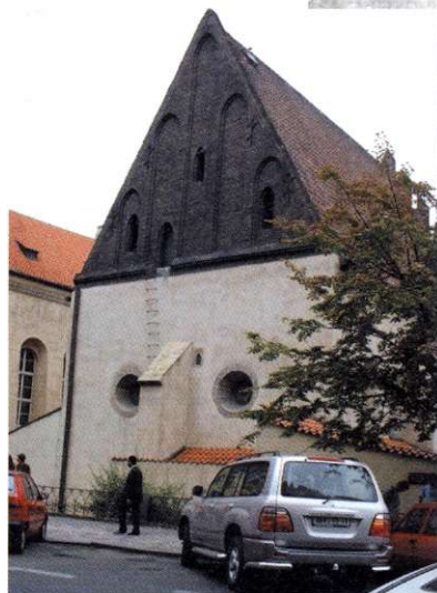
Synagoga Staronowa w Pradze

Legenda ta bardzo długo pozostawała jedynie w ustnej tradycji. Rozstawił ją dopiero wnuk rabina Eliasza, Cwi Aszkenazy rabin Amsterdamu i Lwowa, zresztą protoplasta lubelskiej dynastii rabinów Aszkenazych z I połowy XIX wieku. Dzięki jego synowi, również wybitnemu rabinowi Altony, Jakubowi Aszkenazemu-Emdenowi historia została spisana i to bynajmniej nie w formie legendy czy ludowej opowieści. Ojciec i syn prowadzili nawet debaty czy golem ma naturę ludzką i czy można go zaliczyć do minianu – zgromadzenia 10 mężczyzn gotowych do modlitwy? Debaty te miały miejsce na przełomie XVII i XVIII wieku. Prawdopodobnie w tym czasie historia o golemie dotarła do Pragi czeskiej. W I połowie XIX wieku opowiadano ją już jako praską historię i weszła ona na stałe do kanonu kultury nie tylko Żydów czeskich, ale także samych Czechów. Miejsce chełmskiego rabina Eliasza zajął jego praski odpowiednik Jehuda Loew ben Becelel, a miejscem