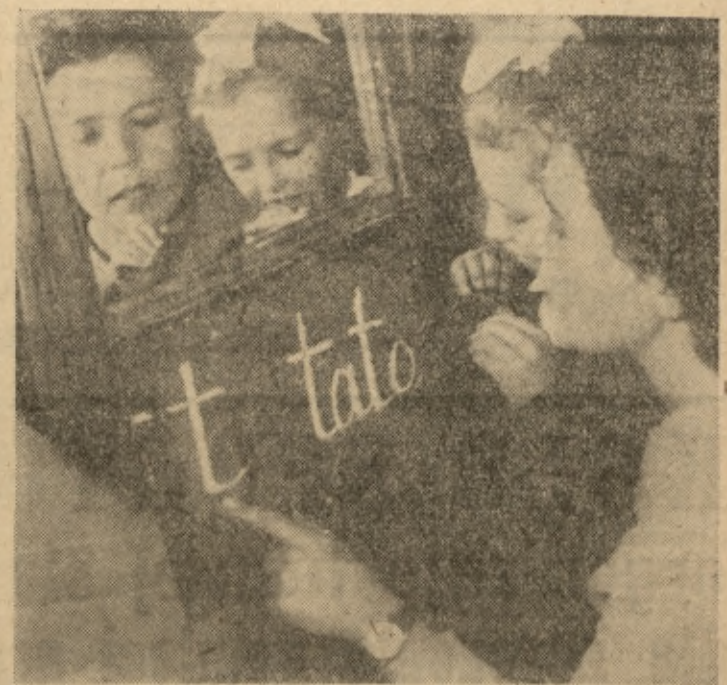
W trudnej sztuce mówienia pomaga dzieciom głuchym... lustro. W nim można skontrolować układ ust przy wymawianiu słowa „tata” i porównać jak to robi pani nauczycielka. Czytaj artykuł niżej.

Członkowie Zarządu Wojewódzkiego Związku Ogrodniczego myśleli od dłuższego czasu nad tym w jaki sposób uświetnić „Dni Lublina”. Postanowiono wreszcie na jednym zebrań zorganizować imprezę, której lubliniacy nie oglądali od lat — wystawę kwiatów, owoców, warzyw, drzew owocowych i krzewów ozdobnych w wystawie, która zostanie uruchomiona na Podzamczu i trwać będzie w dniach od 11 do 18 października obok Instytutu Sadownictwa z Puław, Zakładów Milejowskich, Zakładu Zielin Miejskiej z Lublina wezmą udział ogrodnicy — posiadacze prywatnych sa-