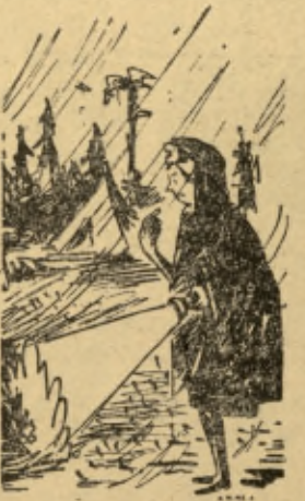
Jednym rytmem biją serca...

Już dwa miesiące minęły od naszego powrotu z obozu, ale wciąż jeszcze we wspomnieniach naszych wracamy do tych beztrojskich i ra dosnych chwil spędzonych w lesie w Obroczy. Długo w pamięci mej pozostała wrażliwość z pierwszej nocnej warty Starsze koleżanki, które przesyły już niejedną nocną wartę mówiąc: „zobaczysz, duchy chodzą”, „Kocowić” można do sta”. Bałam się okropnie. A tu zaraz drugiego dnia po przyjeździe na obóz zastęp nasz miał wartę. Na mnie i koleżankę wypadła ona akurat w „godzinę duchów”.