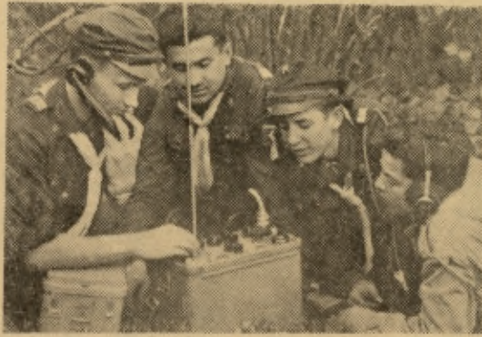
Łączność telefoniczna w takiej akcji to rzecz podstawowa.

Przecinają kule, z hukiem wybuchają granaty, od zapalonych rakiet