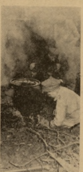
Podczas gdy inni bronił miejsca zrzutów i atakowali młyn, „kuchary” żwawo krzątał się przy kottach...

„Partyzanci” dostają zadanie zlikwidować nieprzyjacielski oddział. Mrok zalega ziemię. Cicho, bez szelestu czuła się „partyzanci”. Już sforowali rzekę. Kilku zlikwidowało nieprzyjacielską czuikę. Są już o 100 metrów, gdy nagle młyn ożył. Powietrze