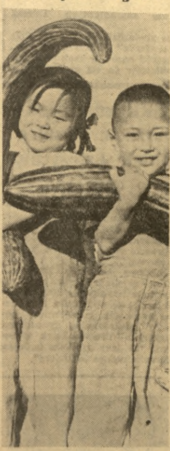
W spółdzielni Cienkovo w prowincji Hopeni zebrano 1950 kg ogórków, których przeciętna waga wynosi 3 kg. Największy okaz waży „tylko” 5 kilogramów.