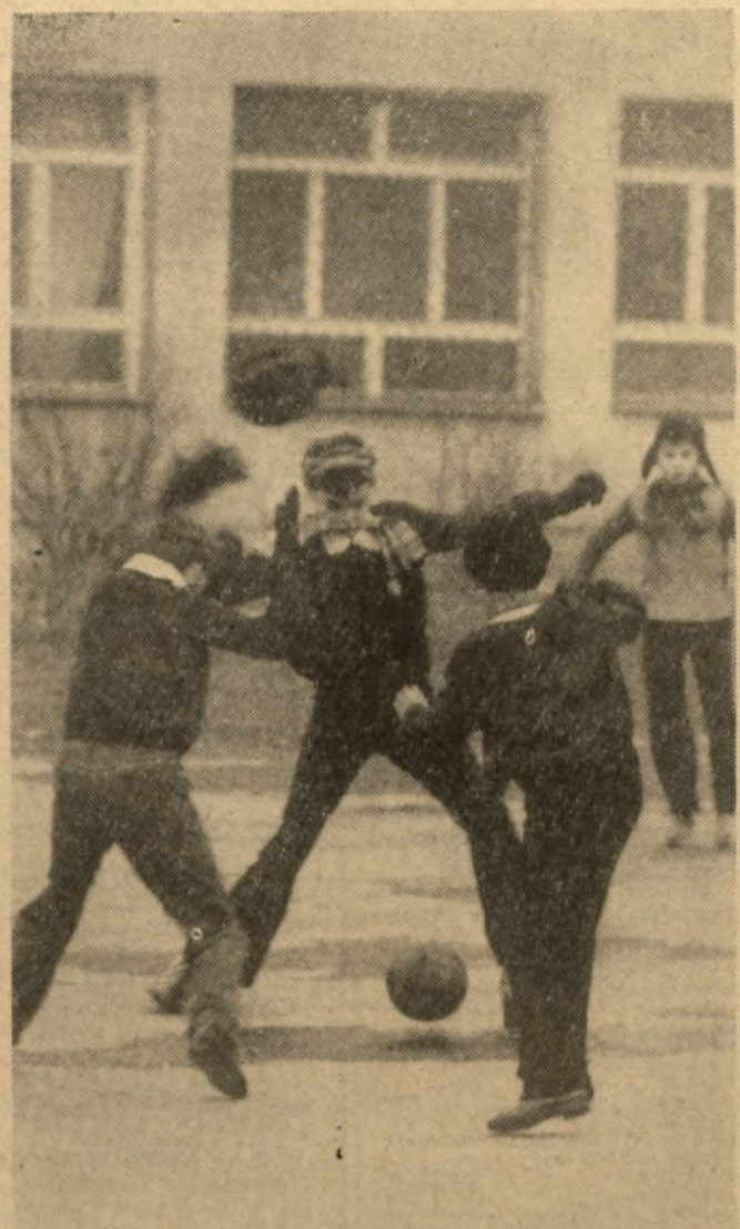
W miejscu przygotowanym na łowisko chłopcy z dzielnicy LSM z powodzeniem grają w piłkę.