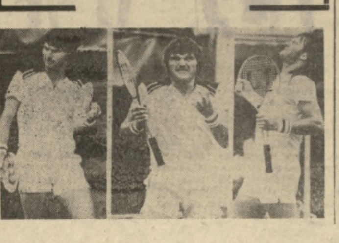
Jimmy Connors na korcie!!! Oto trzy ujęcia amerykańskiego tenisisty z pojedynku półfinalowego, w którym wygrał z Hiszpanem Jose Higueras podczas turnieju w Indianopolis.