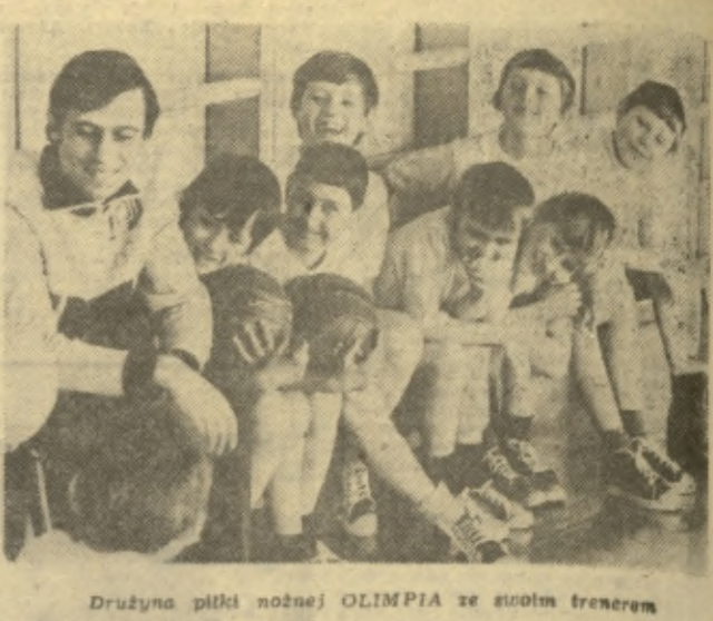
Drużyna piłki nożnej OLIMPIA ze swoim trenerem

Grupa Tacla musiała przygotować odpowiedni grunt, żeby mogli się odświeżyć ślady stóp na szlaku tego niezwykłego stworzenia. Jednakże podłoża było jeszcze za twarde i wyszukanie odcisków, choć wyraźnie widoczne, w szeregach nie były czytelne. Zrobiono jedynie kilkanaście zdjęć fotograficznych.