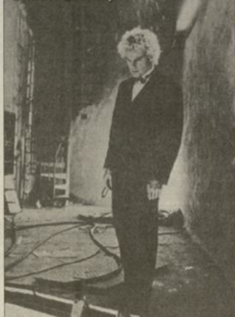
Christopher Lambert w filmie „Subway”

CHOCIAŻ wszystko toczy się tu jak gdyby z góry ustalonym rytmem, nie brakuje napięć i konfliktów. Bo ten podziemny świat jest w gruncie rzeczy tylko odbiciem tego, który istnieje na górze. Trapiące go tam anomalie wraz z ludzką fałają trafiają i do podziemnej kolejki. Tak przedstawia to Anthony Harvey w filmie „Metro” (1966). Jest późna noc i w wyludnionym wagonie kolejki podróżuje niewielki pasażerów. Zainteresowanie młodej, białej dziewczyny wzbudza starający się nie zwracać niczyjej uwagi Murzyn. Dziewczyna próbuje go sprowokować. Najpierw go uwodzi, następnie stara się obrazić. Chce w ten sposób udowodnić sobie samej, że w tym spokojnym na pierwszy rzut oka człowieku tkwi taki sam rasista jak w niej. Klaustrofobiczna przestrzeń wa-