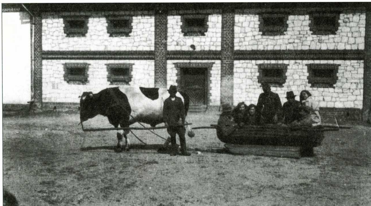
Przejażdżka w zaprzęgu z bykiem, w tle zabudowania gospodarcze w Piotrawinie, lata 30. XX w.