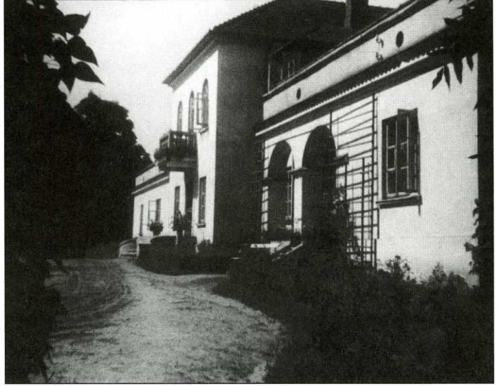
Dwór w Piotrawinie od strony parku

Dokończenie opisu fotografii z IV strony okładki.