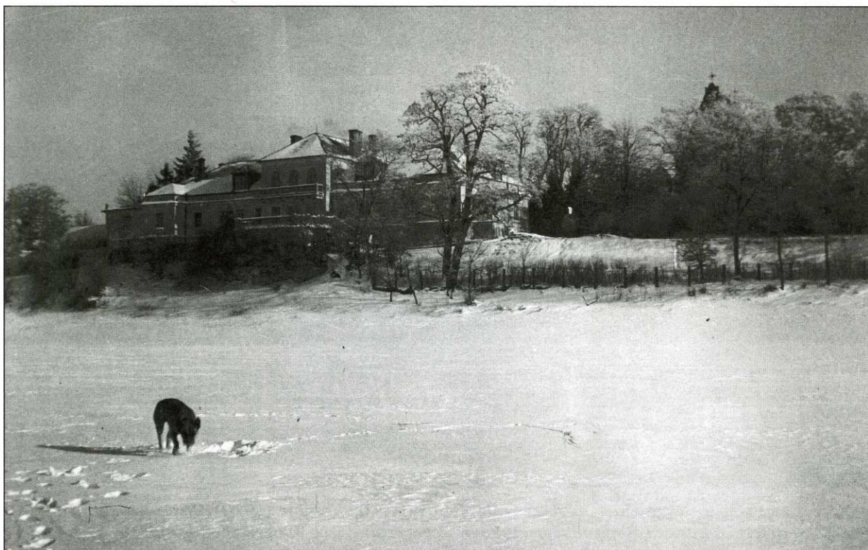
Dwór w Piotrawinie nad zamrzniętą Wisłą