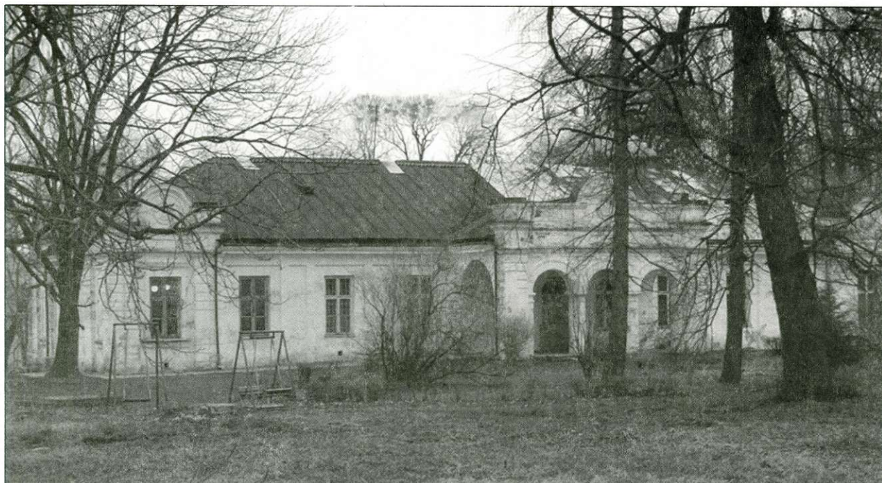
Pałac w Udryczach, fot. A. Szykuła 2008.

5 grudnia 1861 roku, uwzględniający księgozbiór, biżuterię oraz niewielki zbiór dzieł sztuki. Przyczynkiem do dziejów Teresy Kickiej są treści zawarte w literaturze dotyczącej dziejów miejscowości Udrycze. 5