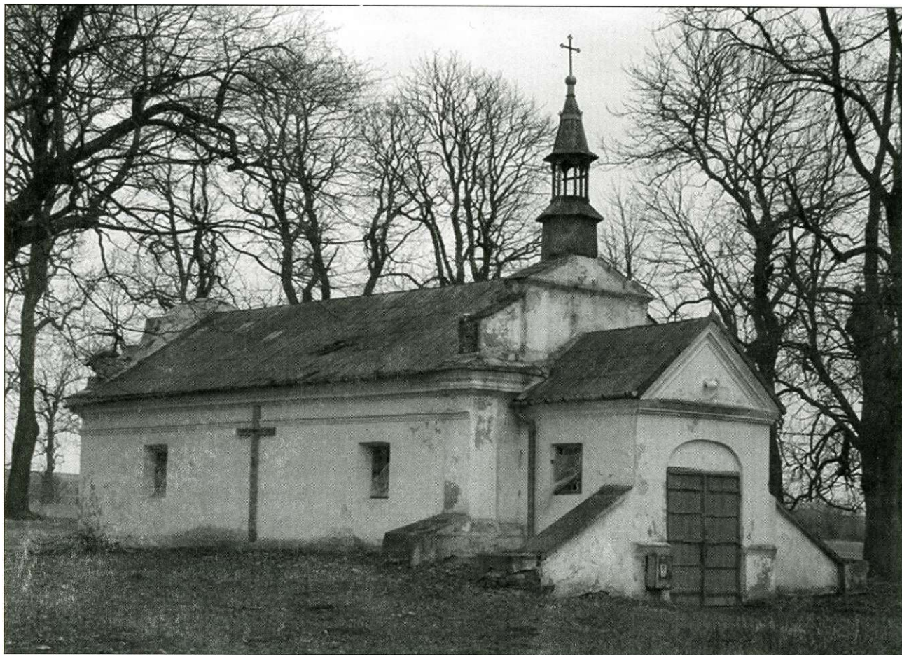
Kaplica tzw. Ariańska w Udryczach