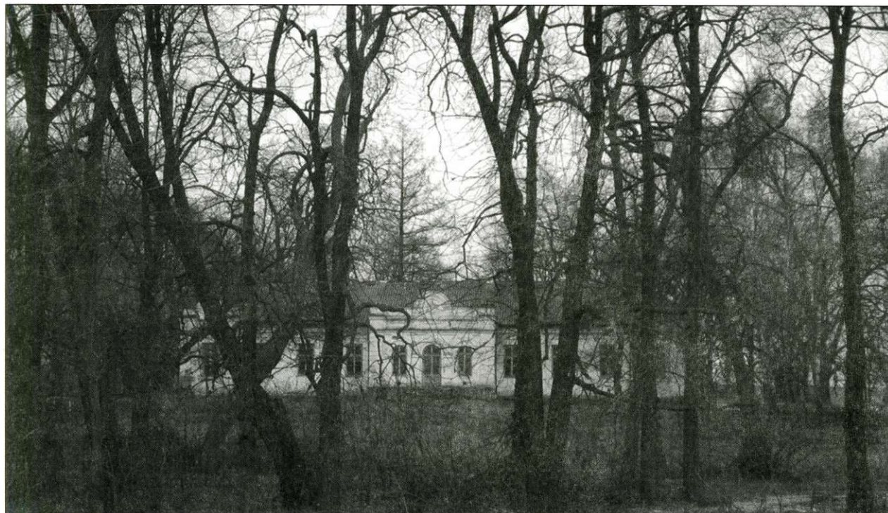
Pałac w Udryczach, fot. A. Szykuła 2008.

czenia [...] i pamięci zostawiła zadatki w licznych darach. Gdy dalsza pora nadchodziła, udała się JW. Koniuszanka z rodzicami i całą rodziną na nabożeństwo podczas którego gęste Msze święte i kościół w światło ubrany okazywał wspaniałe przyjęcie solenizantki. Nareszcie przy rzęśistym ogniu z harmat Te Deum lauda mus śpiewano i celebrant dał do pocałowania patenę. Następnie [...] włościanie ukazywali swoje ukontentowanie [...] ku porze obiadowej liczne sąsiedztwo zbierało się na wyścigi, [...] jak mrok zapadł, ogłosiły harmaty iluminację z powietrznym ogniem, który to ogień okrywał cały wspaniały ogród oraz gorejącą zdobnie cyfrę solenizantki. [...] Jednym słowem wiele prochu spalono ma cześć mojej ciotki w dzień jej imienin. 15