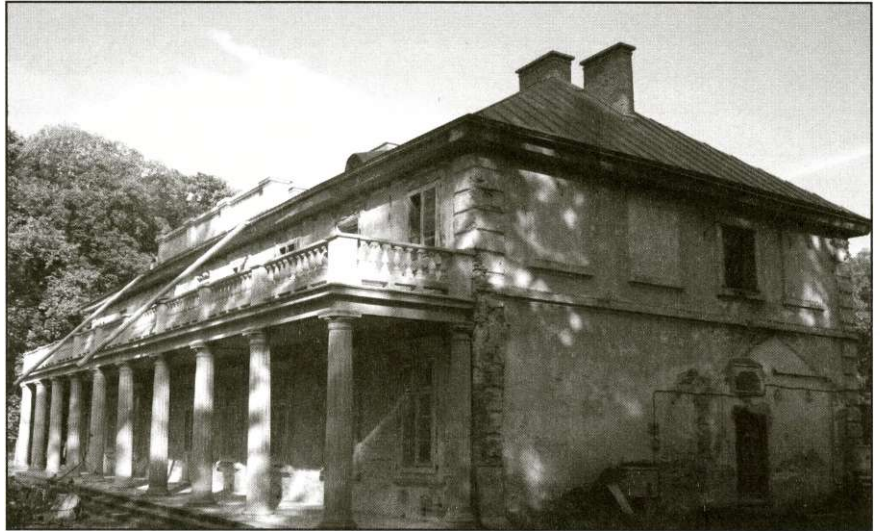
Pałac w Łabuńkach, zrekonstruowana kolumnada i attyka, 2008 r.