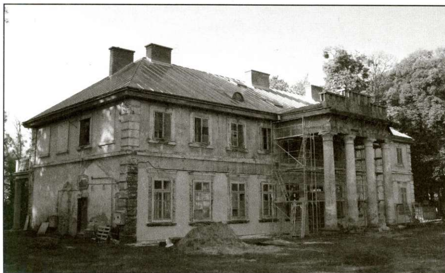
Pałac w Łabuńkach, widok od strony wjazdowej, 2008 r.