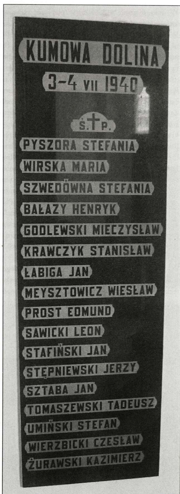
Tablica druga pod dzwonnica na Górze Chełmskiej.