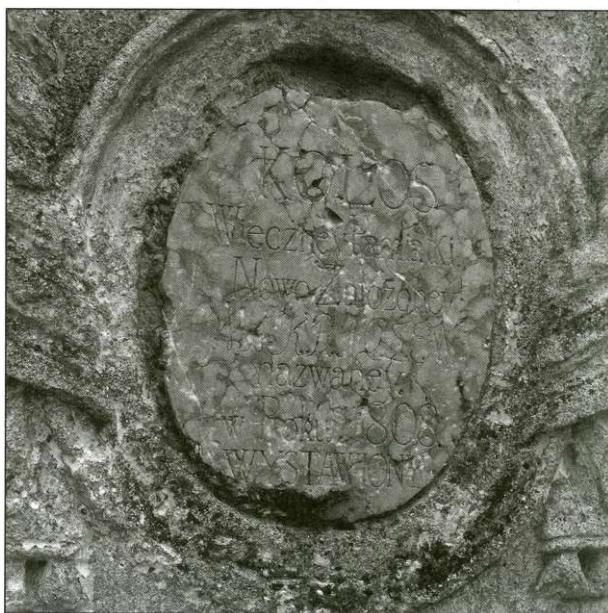
Napis na figurze, fot. Agnieszka Szykuła-Żygawska, 2009 r.