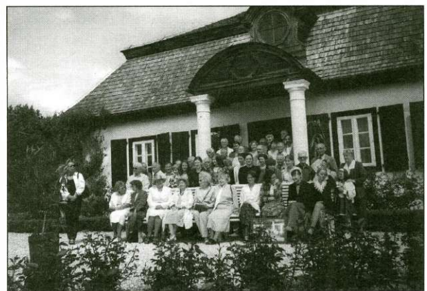
Lubelscy ziemianie w Muzeum Wsi Lubelskiej, przed dworem z Żyrzyna w 2001 r.