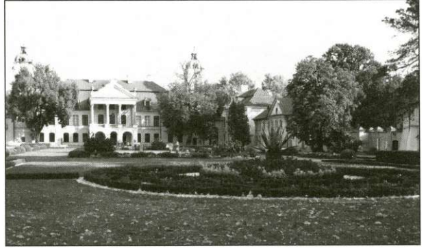
Pałac w Kozłowiec