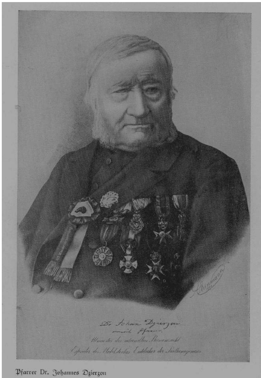
Pfarrer Dr. Johannes Dzierżon