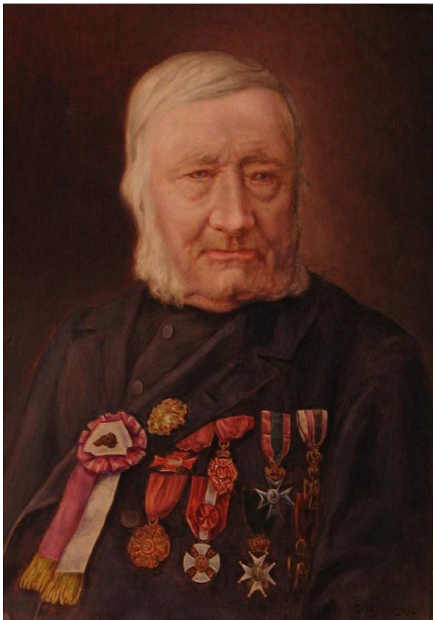
Stefan Dylewski, „Jan Dzierżon”, olej na płótnie, 1936 r. Obraz znajduje się w zbiorach Muzeum im. Jana Dzierżona w Kluczborku