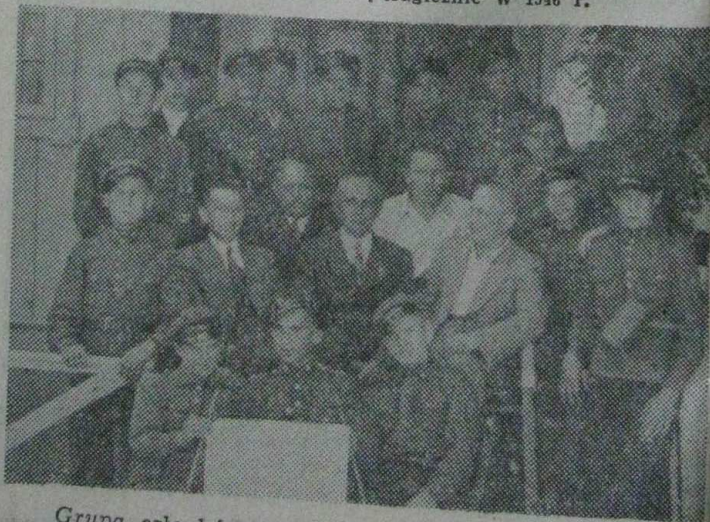
Grupa członków PW z Ciepiewa, spośród których kilku brało udział w walkach w 1939 roku w Lublinie.