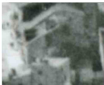
Fragment panoramy Lublina, lata 30., Cyrulicza 14/A fragment of panorama of Lublin in the 1930s, Cyrulicza 14,