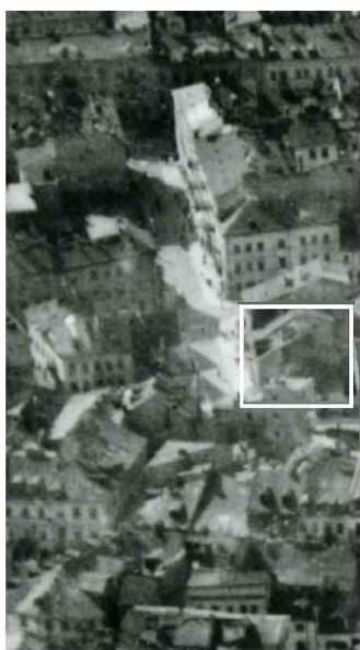
Fragment panoramy Lublina, lata 30., ul. Cyrulicza/A fragment of panorama of Lublin in the 1930s, Cyrulicza street,