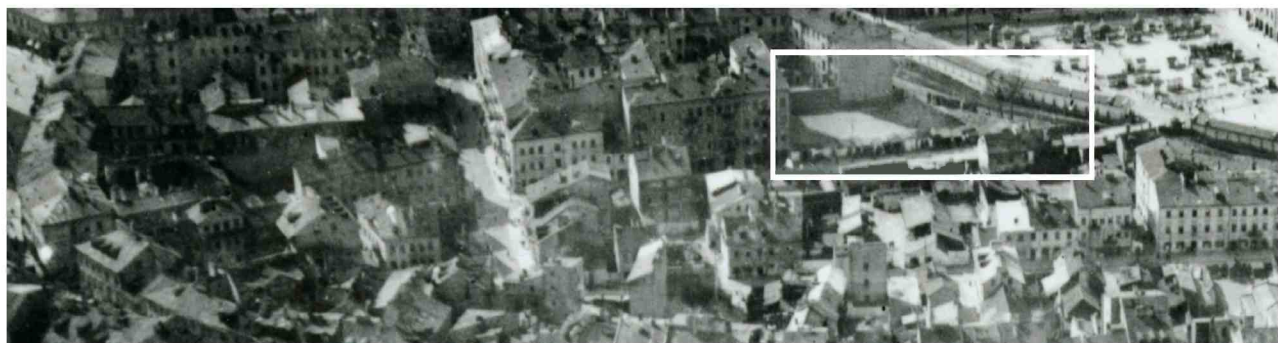
Fragment panoramy Lublina, lata 30., ul. Furmańska/A fragment of panorama of Lublin in the 1930s, Furmańska street,