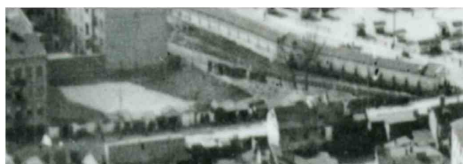
Fragment panoramy Lublina, lata 30., Furmańska 12/A fragment of panorama of Lublin in the 1930s, Furmańska 12,